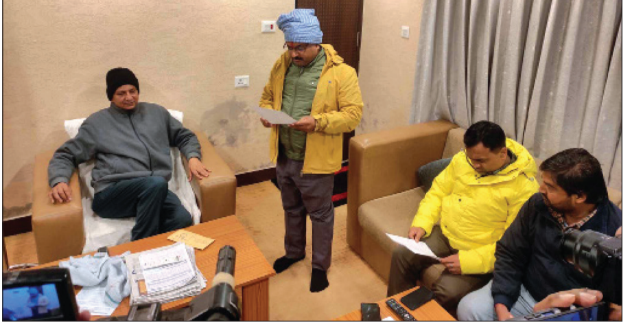
मधेश प्रदेशका मुख्यमन्त्रीलाई राजीनामा पत्र बुझाउँदै जनमतका मन्त्रीहरू ।