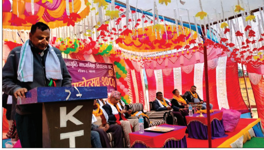
महोत्तरीको बर्दिबासमा आयोजित कार्यक्रमलाई सम्बोधन गर्दै मधेश प्रदेशका मुख्यमन्त्री सरोजकुमार यादव ।

टुडे समाचारदाता बर्दिबास । मधेश प्रदेशका मुख्यमन्त्री सरोज कुमार यादवले शिक्षा क्षेत्रलाई प्रदेश सरकारले उच्च प्राथमिकतामा राखेर काम गरिरहेको बताएका छन् । मुख्यमन्त्री यादवले महोत्तरी जिल्लाको बर्दिबास नगरपालिका वडा नं ३ पाटुमा रहेको श्री जन जागृति माध्यमिक विद्यालयको स्वर्ण महोत्सवको मंगलबार