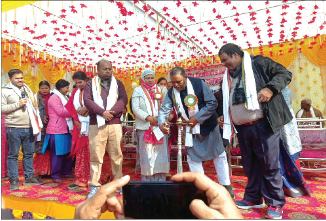
जनता समाजवादी पार्टीक अध्यक्ष उपेन्द्र यादव मंगलबार सप्तरीका कार्यक्रमलाई उद्घाटन गर्दै ।

राजविराज नगरपालिकाद्वारा आयोजना गरिएको उक्त कार्यक्रममा प्रमुख अतिथिको आसनबाट बोल्दै पूर्व उप प्रधानमन्त्री समेत रहेका जसपा अध्यक्ष यादवले इन्जिनियरिङ शिक्षा अध्ययनका लागि यहाँ विद्यार्थीहरू बाहिर जानुपर्ने अवस्था अन्त्यका लागि आफूले आफ्नो कार्यकालमा निर्वाचन क्षेत्र विकास कार्यक्रमको बजेटबाट कलेज भवन निर्माणमा सहयोग गरेको बताए । दश जनशक्ति उत्पादन तथा यहाँको आर्थिक प्रणालीमा सुधार ल्याउन कलेजले महत्वपूर्ण योगदान पुऱ्याउने उनको भनाइ थियो । अध्यक्ष यादवले मुलुकमा जलश्रोत, पर्यटन, कृषि लगायतको प्रचुर सम्भावना