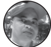
धनेश्वर ठाकुर धनुषाधाम, ४ लक्ष्मीपुर हाल सात सगुण पार दोहा कतार

छोरा छोरी मा भेदभाव हाम्रो समाज ले किन गर्छ अपराध छोरा घुम छ आवाज जस्तो खान्छ गाजा भाग तै पनि गर्छ हाम्रो समाज ले छोरी लाई नै अपमान जब आमाको गर्भमा छोरी हुन्छ बुवा आमा लाई टेन्सन हुन्छ अब हाम्रो छोरी जन्मियो भने विहेमा धेरै खर्च हुन्छ आदि इत्यादि सोचन थाल्छ तर हाम्रो समाज ले यो सोचदैन कि जुन कोख बाट छोरा हुन्छ त्यहि कोख बाट छोरी हुन्छ जब हामीले छोरा सरह छोरी लाई पढाए लेखाएर सक्षम बनायो भने छोरी छोरा भन्दा कम हुदैन जब छोरी घर बाट पढ्न जादा पनि बुवा आमा लाई टेन्सन हुन्छ कि छोरी पढ्न गयो केहि हुन्छ कि अलि डियो आयो भने बुवा आमा ले अनेक किसिमको प्रश्न सोध छन तर त्यही छोरा आवाज जस्तो घुमे र आउदा बुवा आमा लाई टेन्सन हुदैन कारण एउटै हुन्छ छोरा मान्छे हो केही हुदैन भन्छ र छोरी मान्छे ले हाम्रो इज्जत फाल्छ भन्ने डर हुन्छ जब छोरी प्रति बुवा आमा को विश्वास हुदैन भन्ने अरुको के विश्वास के हुन्छ पहिला आफ्नो छोरी लाई आफु ले विश्वास गर्नु र हेर्नु छोरा भन्दा छोरी केहीमा कम हुदैन आज भोलि छोरी मान्छे ले देश चलाका छन तर छोरी प्रति बुवा आमा समाजको आश विश्वास हुनु अति जरुरी छ छोरी छोरा एक सामान नजर ले हेरौं गाम समाज देश सबै बदलिन्छ