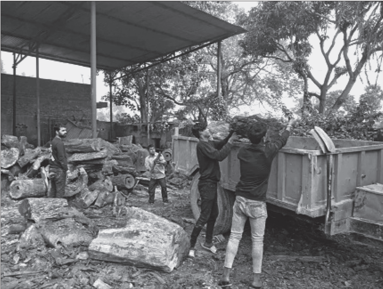
जाडोले जनजीवन प्रभावित भइरहेको बेला जलेश्वर नगरपालिकाद्वारा जलेश्वरको ठाउँठाउँमा आगो बालनका लागि दाउरा वितरण गरिएको गरिँदै ।