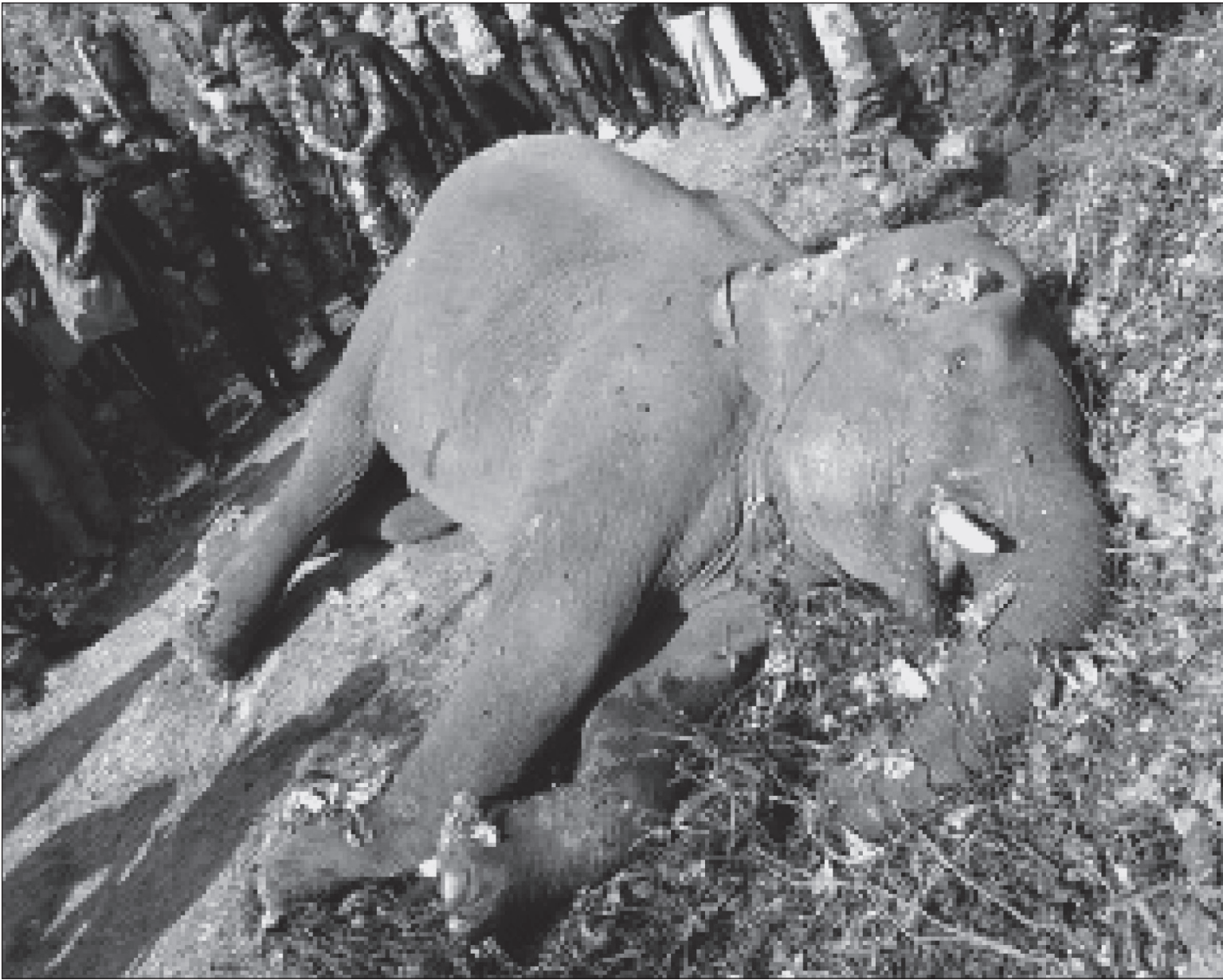
मोरङको सुन्दरहाँचा नगरपालिका-१० मुनालभोडास्थित जनजागरण सामुदायिक वनभित्र गोली हानेर हत्या गरिएको जङ्गली हाती। सोमबार मृत अवस्थामा फेला परेको जङ्गली हातीको पुच्छर काटेर गायब गरिएको छ।