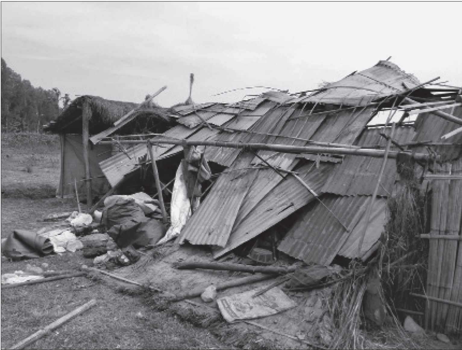
भापाको कमल गाउँपालिका-५ स्थित चौंजु-टुके बस्तीमा शनिवार विहान जङ्गली हात्तीले पुर्याएको क्षति। हात्तीले स्थानीय चार जनाको कच्ची घरमा क्षति पुर्याएको छ।