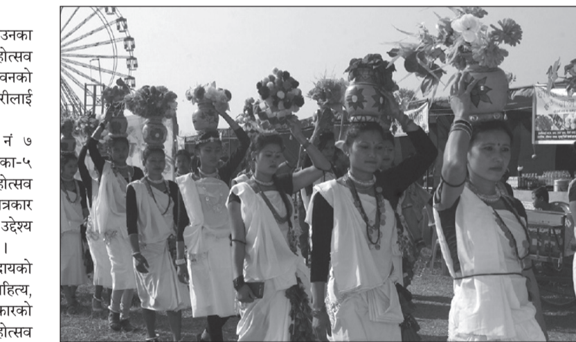
पावन अवसरमा खिचरा महोत्सव हुँदै आएको छ। महोत्सव मूल समारोह समितिका संयोजक

दुडे समाचारदाता चितवन। थारू संस्कृति जोगाउनका लागि यही पुस २८ गतेदेखि खिचरा महोत्सव आयोजना गर्न लागिएको छ। पूर्वी चितवनको खैरहनीमा नवी खिचरा महोत्सवको तयारीलाई तीव्र पारिएको हो। थारू कल्याणकारिणी सभा क्षेत्र नं ७ को आयोजनामा खैरहनी नगरपालिका-५ गौरचना आगामी माघ १० गतेसम्म महोत्सव सञ्चालन हुनेछ। आयोजकले शनिबार पत्रकार सम्मेलनको आयोजना गरी महोत्सवको उद्देश्य र तयारीका बारेमा जानकारी गराएको हो। माघी पर्वका अवसर पारेर थारू समुदायको सांस्कृतिक, वेशभूषा, भाषा-साहित्य, कला-संस्कृति एवं थारू खानाका परिकारको संरक्षण तथा प्रवर्द्धन गर्ने उद्देश्यले महोत्सव आयोजना गरिएको हो। विगत नौ वर्षदेखि प्रत्येक वर्ष माघ १ गते पर्ने खिचरा पर्वको