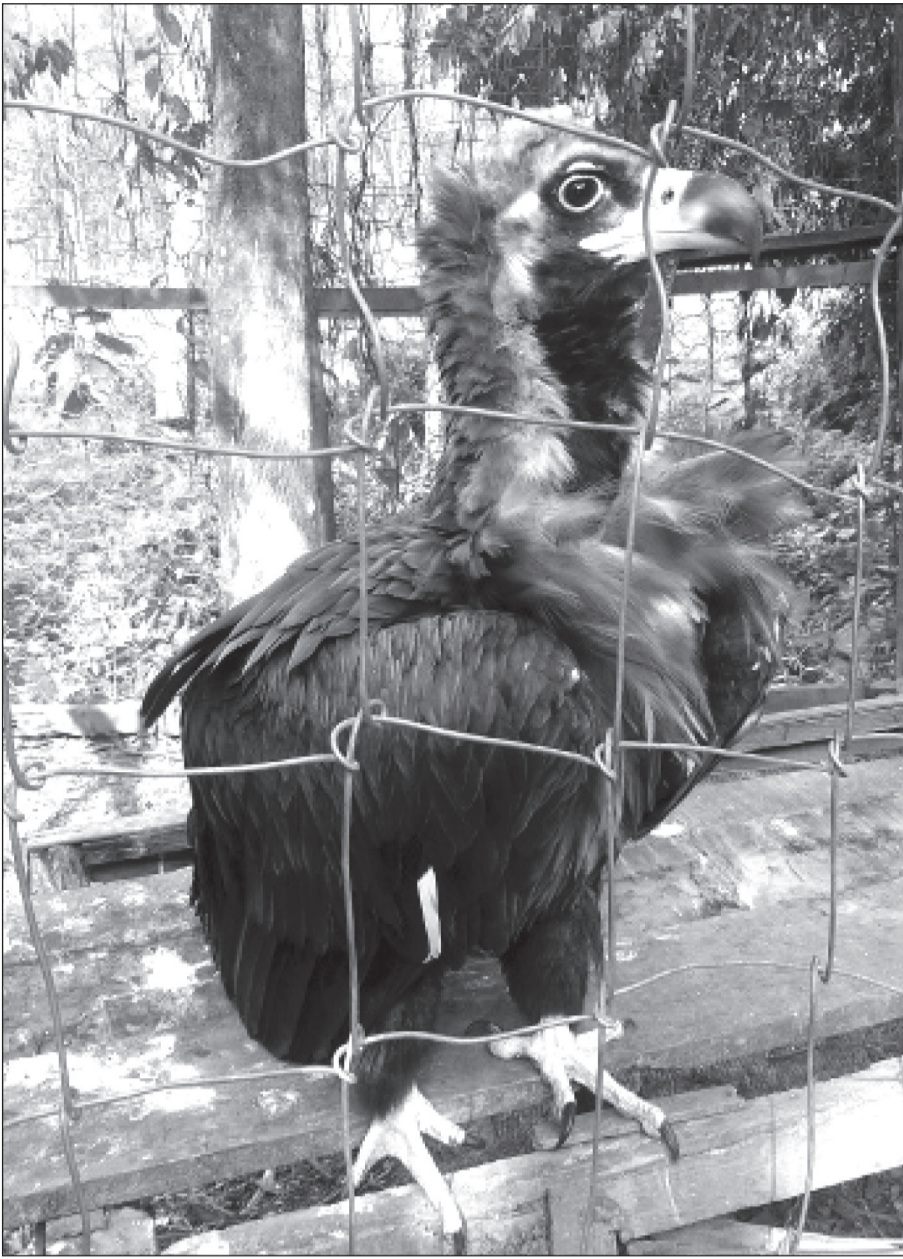
मोरङको बेलवारी नगरपालिकास्थित बेतना सिमसारमा संरक्षण गरेर राखिएको राज गिद्ध।