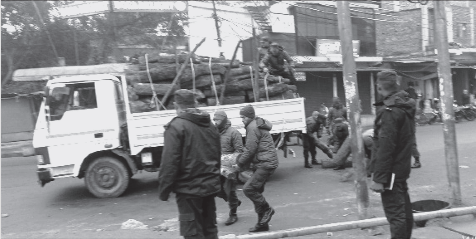
चिसो बढेपछि नेपालगन्ज उपमहानगरपालिकाले चोकमा सामूहिक आगो ताप्ने व्यवस्थाका लागि नगर प्रहरीमाफत स्थानीयलाई दाउरा वितरण गर्दै।