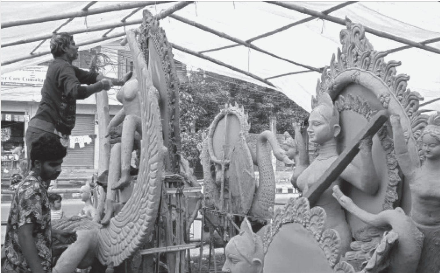
सरस्वती पूजा नजिकै गर्दा जनकपुरधाममा सरस्वतीको मूर्ति निर्माण गर्दै कालीगढ ।