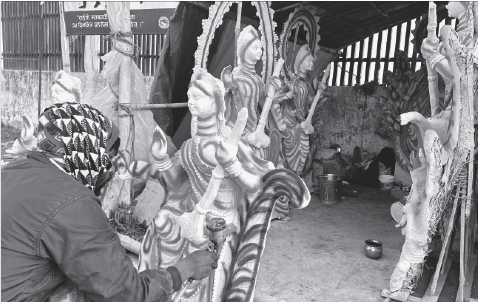
श्रीपञ्चमी अर्थात् वसन्तपञ्चमीको दिन मनाइने सरस्वती पूजाको लागि मलङ्गाको जिल्ला विकास चोकमा सरस्वतीको मूर्तिमा मेसिनले रङ्ग लगाउँदै मूर्तिकार । यसवर्ष फागुन २ गते बुधवारका दिन वसन्तपञ्चमी परेको छ ।