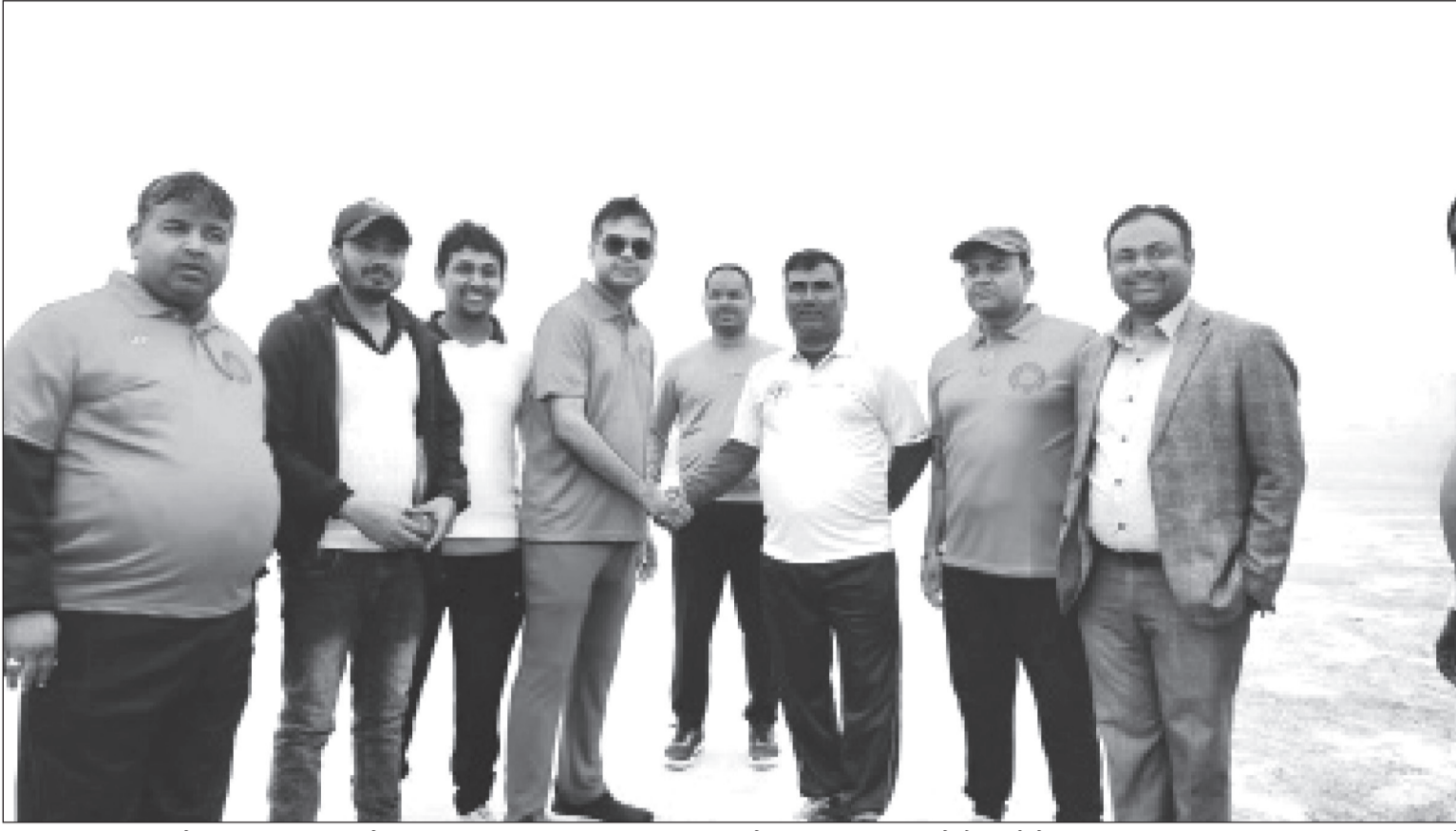
शनिबार जनकपुरधामको बारहविधामा सम्पन्न नेपाल पत्रकार महासंघ धनुषा र जनकपुरधाम उद्योग वाणिज्य संघ विचको मैत्रीपूर्ण खेलमा महासंघ धनुषा विजयी भएपछि शुभकामना दिँदै संघका पदाधिकारी।