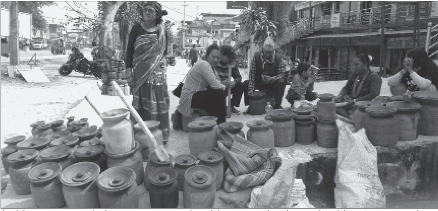
मोरङको बेलबारी नगरपालिकास्थित सोमबारे बजारमा विक्रीका लागि राखिएको काठको ठेकी । दूध जमाएर मोही पार्नका लागि प्रयोग गरिने ठेकी यहाँ एक हजार पाँच सयदेखि तीन हजार सम्ममा विक्री हुने गरेको छ ।