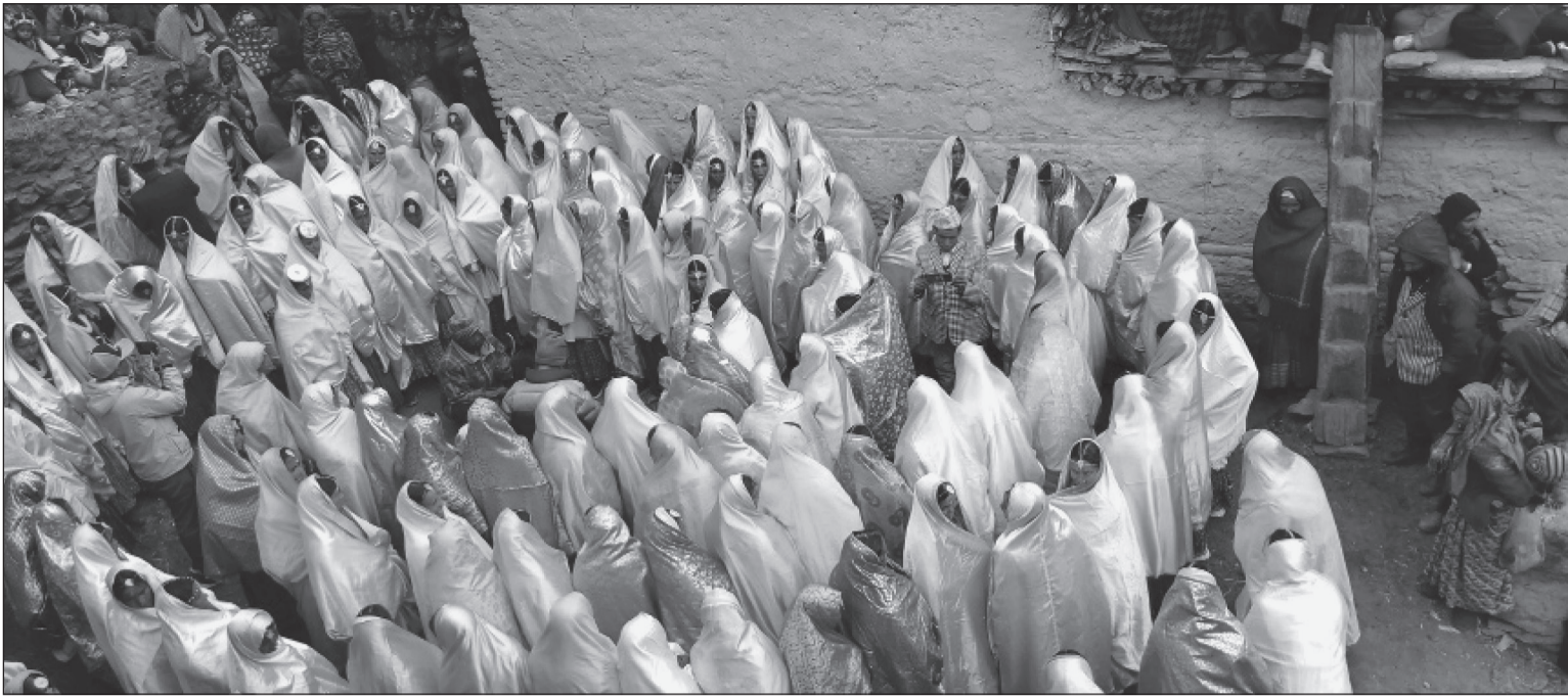
हुम्लाको सिमकोट गाउँपालिका-१,२ ठेगे गाउँमा लामे चैतलो पर्वमा चैतलो खेल्दै स्थानीय महिला । चैतलो पर्वमा (फाक,चाची)का गीत गाउने गरिन्छ ।