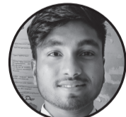
लेखक:- राम रुद्राक्ष मण्डल ठेगाना:- लक्ष्मीनिर्या गा.पा.-१, सिन्धुजोडा धनुषा, नेपाल ।

गरिबी सफलताको चुचुरोमा पुग्ने बाटो हो । गरिबी कमल फुल्ने फोहोर हिलो माटो हो ॥