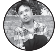
लेखक :- अनित कुमार मण्डल बि.एड. प्रथम बर्ष जनकपुर - १५ लोहना

ऋतुको राजा वसन्तले ल्यायो हरियाली । संसारको कुना कुनामा फैलायो खुशहाली ॥