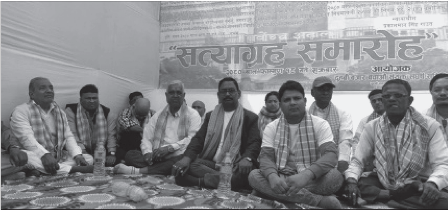
सर्वोच्च अदालतको आदेश अज्ञात गर्दै ६ लेन सडक विस्तार आयोजना कार्यालयले बिनामुआब्जा संरचना हटाउन खोजेको भन्दै सुनसरीको दुहबीका स्थानीयले शुक्रबार सुरु गरेको सत्याग्रहमा सहभागी स्थानीयवासी ।