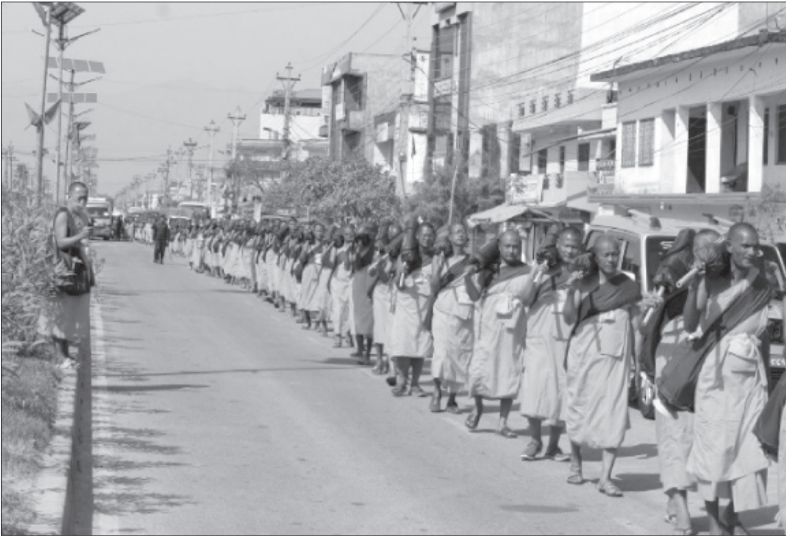
लुम्बिनीबाट रामग्राम स्तूपमा पूजा तथा प्रार्थना गर्न जाने क्रममा आइतबार दिउँसो पश्चिम नवलपरासीको परासीमा आइपुगेका भिक्षुहरु ।