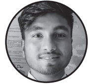
लेखक :- राम रुद्राक्ष मण्डल ठेगाना:- लक्ष्मीनियाँ गा.पा.-१, सिनुरजोडा धनुषा, नेपाल ।

म रू होइन सधैं हास्य चाहन्छु । म मर्न होइन सधैं बान्छ चाहन्छु ॥