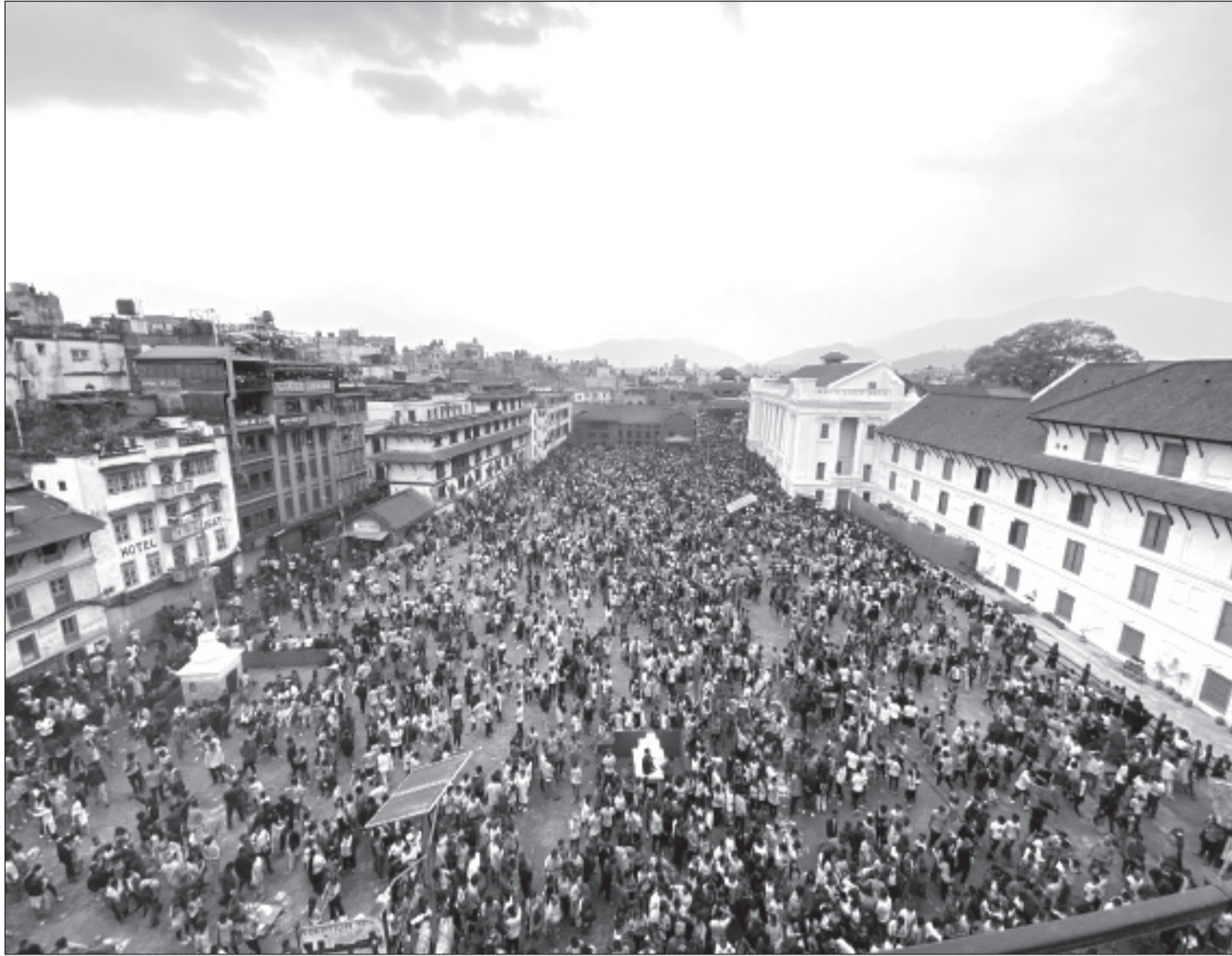
फागुपूर्णिमाको दिन आइतबार काठमाडौंको हनुमानढोका दरबार क्षेत्र, वसन्तपुरमा रङ्गले रङ्गिएका सर्वसाधारणको घुइँचो ।