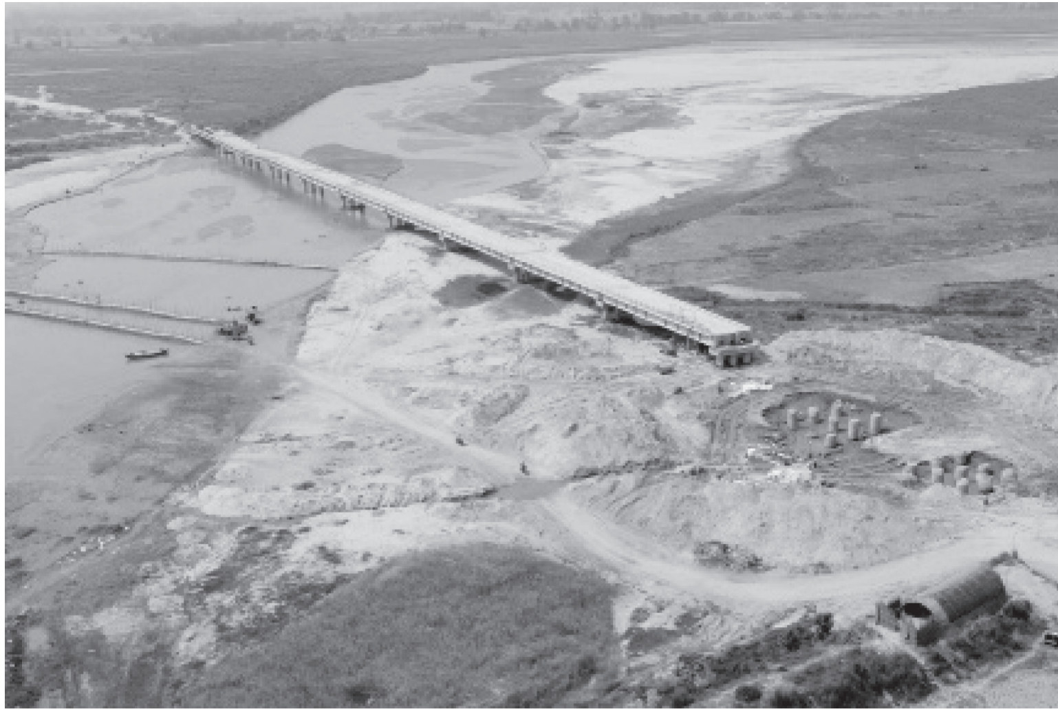
निर्माण सम्पन्न भएर उद्घाटन नहुँदै भासिएको हुलाकी राजमार्ग अन्तर्गत धनुषा र सिरहालाई जोड्ने कमला पुलको पुनर्निर्माण हुँदै ।