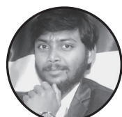
लेखक : बबलु शर्मा

यहाँ मातृभूमि त्यागि दिनप्रतिदिन विदेशीनेको लहर भेटिन्छ मैलापाखा गर्ने त्यो विरे नि आजभोलि गाऊँ छोडि शहर भेटिन्छ हँदै छोरा कुदै एकलै बुढेसकाल कटाइरहेकि बुढि आमा मर्नु भन्दा पहिले छोरोको अनुहार हेर्न पाऊँ भन्ने प्रहर भेटिन्छ कसको के नै विश्वास गर्नु छ र यो स्वार्थी दुनियाँमा अमृत पिताउछु भन्ने कै ब्यवहारमा जहर भेटिन्छ पाप पखाल्न मठ,मन्दिर,तीर्थ धाउने धनीहरू,जाउ पखाल पाप उ पर त्यो गरिब को दैलो मा पाप पखाल्ने नहर भेटिन्छ हाम्रो देश मा विदेशीनेको लहर भेटिन्छ