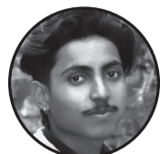
लेखक : अंकित पाठक सहिदनगर न.पा -०१ टोल बेमरखि

पैसाले यहाँ सबै थोक, भेटिने हो जीवनको त्यो सार बुझिसके । सबैको साथ छुट्यो यहाँ, कमाउनलाई घर परिवार छुट्टि सके।