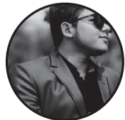
लेखक : सुरज बस्नेत काठमाण्डौ, नेपाल

प्यास ले पानी भेटेर नि पिउन नजानेरा ब्यार्थै कुवासङग जलेउ,अचम्म लाग्छ।