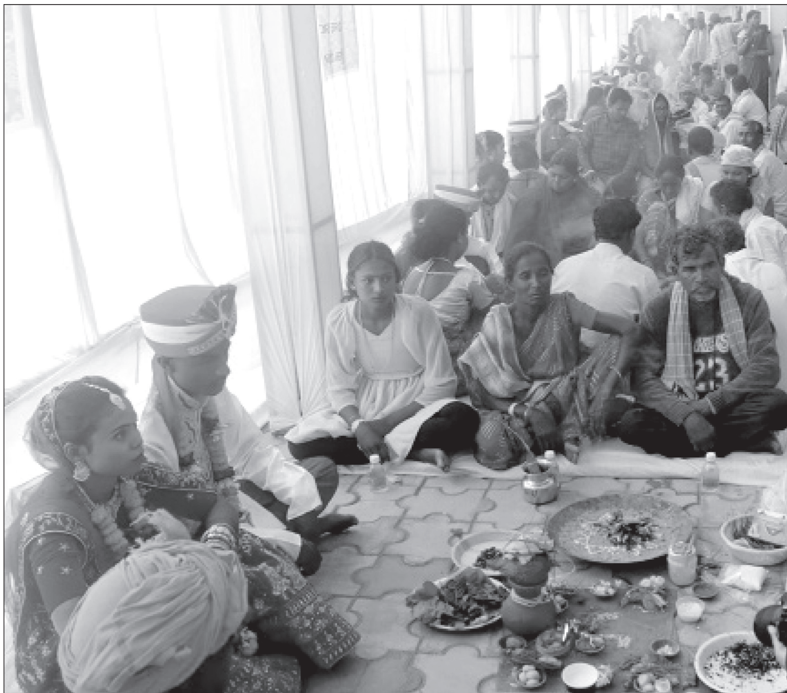
माहेश्वरी महिला मञ्च विराटनगरद्वारा बिहीवार अतिथि सदनमा आयोजित सामूहिक विवाहमा १५ जोडी आदिवासी युवायुवती विवाहमा सहभागी हुँदै।