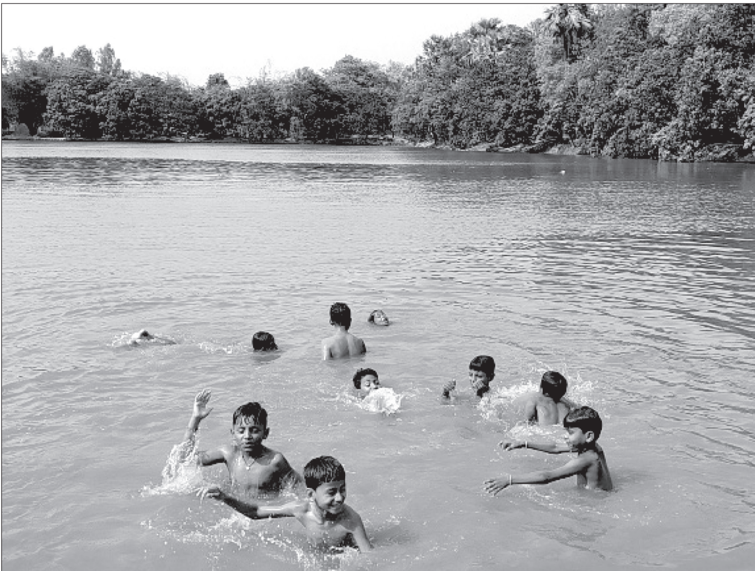
अत्यधिक गर्मी बढेपछि महोत्तरीको जलेश्वर नगरपालिका -८ स्थित गोतमान सागर (पोखरी) मा पौडी खेलेर गर्मी छल्दै बालबालिका ।