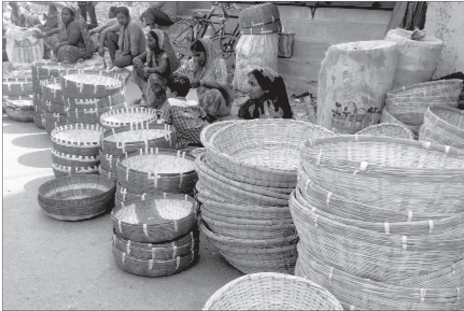
सुनसरीको इन्डस्ट्रियल बिहीबार हटियामा बिक्रीका लागि राखिएका बाँसको चोयाबाट बनेका ढाकी। ढाकीको आकार हेरेर तीन सयदेखि पाँच सय रुपियाँसम्ममा बिक्री हुने व्यापारी बताउँछन्।