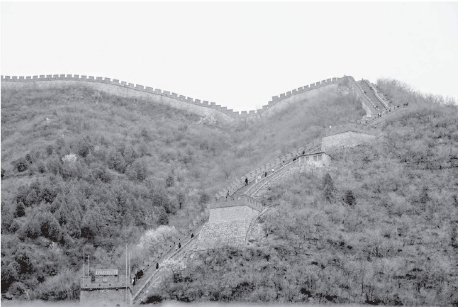
चीनमा रहेको सबैभन्दा लामो मानवनिर्मित संरचना पर्यटकिय स्थल ग्रेटवाल अवलोकन गर्न आएका पर्यटका