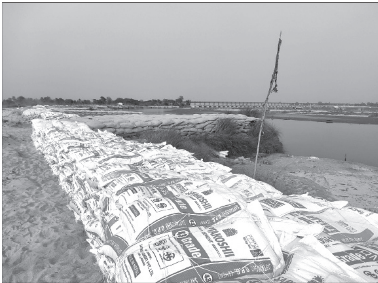
वर्षामा आउने सम्भावित बाढीबाट जोगिन सपतीरीको हुनुमानगर कंकालिनी नगरपालिका -१ स्थित सप्तकोशी ब्यारेजको किनारामा बोरोमा बलुवा भरेर निर्माण गरिएको अस्थायी तटबन्ध।