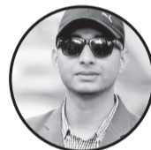
लेखक: राजन ग्हा महोत्तरी, पिपरा गा.पा.-०५

१. किन यो संसारमा, छोरीलाई नि बोभ भन्ने! लिन्छन् नि दाइजो कोही, छोरी किन बोभ हुने! भाग्यको रेखामा त छैन् कतै दाइजो दिने! धनको छ लोभ, लोभी सँग किन सम्बन्ध जोड्ने! २. पैसाको लेनदेन, व्यापारी बन्न आयो सबै! कर्जाको बोभ तल, एकलै बुवा संघर्ष गर्दै! लाखौंको खेल गरी किन कन्यादान गर्दै! बर्षौं लाग्नेछ त्यो बुवालाई रिनको बोभ टाँदै! दाइजोको साथ बुहारी कस्तो चाहिन्छ?? ३. पढाइ-लेखाइमा राम्रो, सुन्दर अनुहार भएको! घरको नि काम गर्ने, टन पैसा नि कमाएको! बोर्लिन-व्यवहारले नि मन सबको जित्ने खालको! आदर नि गर्ने र भगवानमा नि विश्वास भएको! ४. दाइजो लिएर कस्तलाई हेर्नु भाछ धनी भएको! त्यही दाइजो दिएर लाखौं "बा छ" रिनी भएको! सब भन्दा ठुलो, कन्यादान गर्ने बा-आमा हो! नबन्नुस् पापि , रुवाएर मनलाई लाखौं बाको! ५. विवाहको नाउमा यो कस्तो चल सुरु भयो! लक्ष्मी ऊ घरको, किन सरुसमा अरु भयो! पिडाको तौल कस्तो गर्न सक्छन् बा-आमाको! आज त्यो छोरी सुरूरु रुदै बिदा भयो!