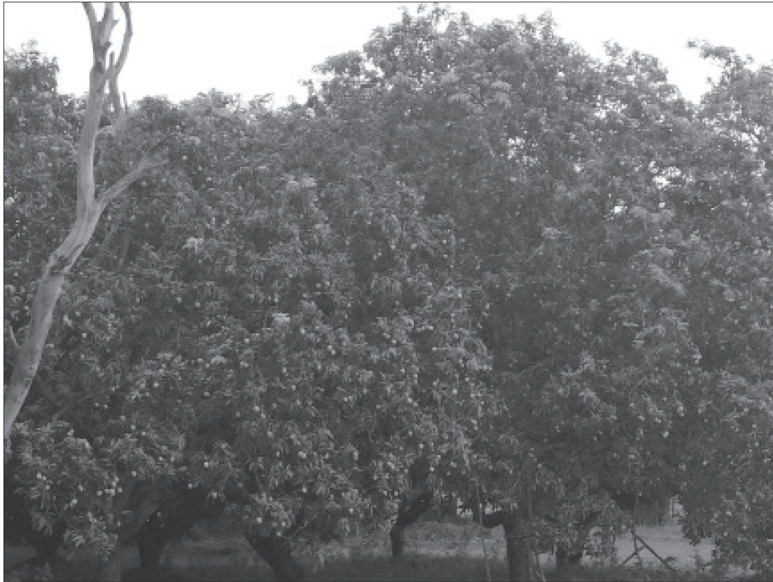
महोत्तरी जिल्लाको एकडारा गाउँपालिका- १ स्थित बगैँचामा लटरम्म फलेको आँप।