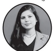
नाम: रिशिता ग्हा बलवा ना पा : ७ बनौटा

यो मुटु तिमी ले हैन आफै ले टुक्राको छु ॥ यो शरीर तिमी ले हैन आफै ले सुकको छु । सम्भना त धेरै थियो तिमी सँग ॥ तर यो मुटु ले केहि भन असिबकार गरो तिम्रो कथामा म न मागिएको पात्र थिए ॥ तियसैले तिम्रो र मेरो कुनै कथा बनेना