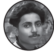
लेखक : अंकित पाठक सहिदनगर न पा -०१ टोल :- बेमरखि

आमा, हजुरको ममता हजुरको माया । पाए छैन कहिँ पनि तपाईंको आँचलको जस्तो छाया । जन्म मात्रै होइन आमा मलाई जीवन पनि दिनुभयो। मेरो हिस्सामा परेको दुःख र पीडा खुशी साथ आफ्नो भाग्यमा लिनुभयो । मेरि आमा मेरो हरेक दुःख र पीडाको दबाइ छिन् । मेरो हरेक चिन्ताको मेरि प्यारि आमा एक मात्र उपाय छिन् । तिम्रो माया मेरो लागि मलम छ आमा मेरो सारा पीडा भुलाइदिन्छ दुःखको बखतमा तिम्रो कारणले मेरो जीवन उज्यालो छ मेरि आमा । थाहा छैन तिमी मेरो लागि कति पिडालाई सहिदिन्छौ एकै पटकमा ।