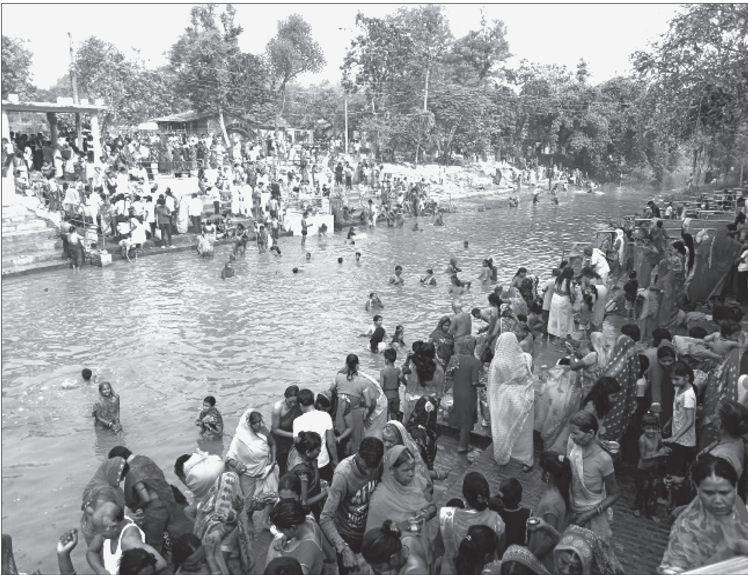
जानकी नवमी उत्सवको अवसरमा शुक्रबार जनकपुरधामको दुधमती नदीमा शाही स्नान गर्दै भक्तजन ।