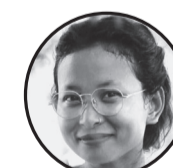
लेखक : रशमी दनुवार

आमा को मुटुमा बने सपनाहरु, सुनौलो सूर्य भै चम्कदै, हजारौं सपना बुन्दै जान्छन्, प्रत्येक पाइला, प्रत्येक बिहाना तिम्रा नयनले देखेको उज्यालो, तिमीले ख्वाएको दूध भै पवित्र, सपना हर एक रात सपनामा, फूलमा सिञ्चित तिमीले बुनेको। सबै आमा को सपना एउटै, सन्तानको सुख र सन्तुष्टि, आफ्नो आँसु लुकाउँदै हिँड्छन्, सपना पूरा होस् सन्तानको। सपना छोरीको सुनौलो बिहानी, सपना छोराको सफल यात्रा, आफ्नो जीवन सारा अर्पण गर्छिन्, सबै आमा को सपना यही हुन्छ। जीवनको हेरक मोडमा, आमाको सपना साथ, तिमीले बुनेको भविष्य, हामी सबैको उज्यालो बाटो। आमाको मनमा मात्र एउटै सपना, सन्तानको खुशी, सन्तानको हर्ष, तिम्रो सपनामा सधैं बाँच्न खोज्छिन्, सबै आमा को सपना यही नै हुन्छ।