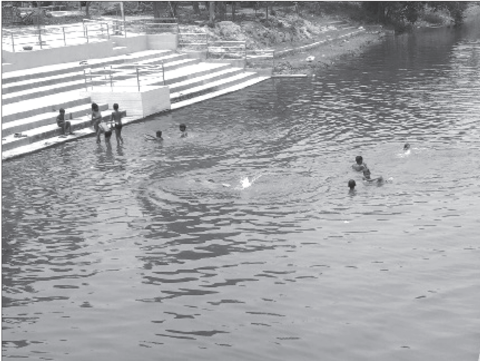
मधेश प्रदेशको राजधानी जनकपुरधाममा गर्मी बढेसँगै जनकपुर-२२ दुधमती नदीमा शुक्रबार गर्मी छल्दै बालबालिकाहरू।