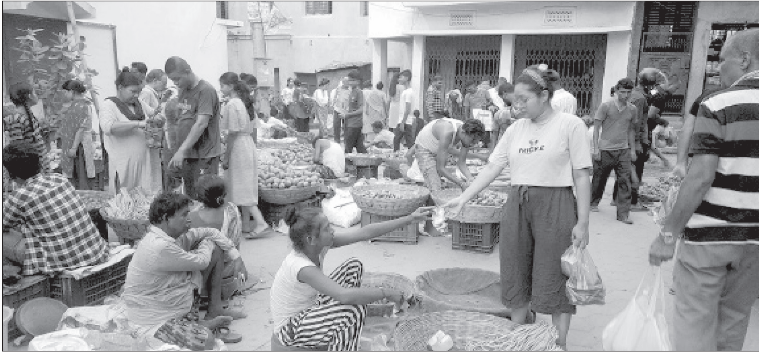
वीरगञ्ज महानगरपालिका ८ स्थित बिरामी तरकारी किन्दै सर्वसाधारण। यहाँ तरकारी अन्यत्र भन्दा सस्तोमा पाइने उपभोक्ता बताउँछन्।