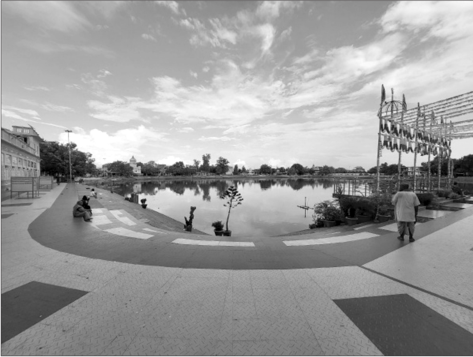
मधेशको राजधानी जनकपुरधामको पवित्र सरोवर गंगा सागरको मनमोहक छवि ।