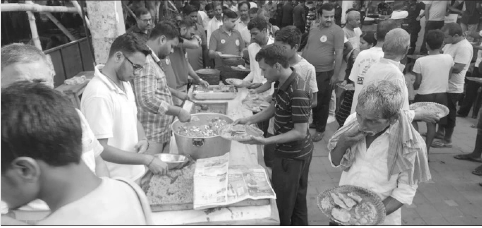
वीरगंजमा एतिहासीक रथ यात्रापछि गहवामाई मन्दिरमा महा प्रसाद वितरण :