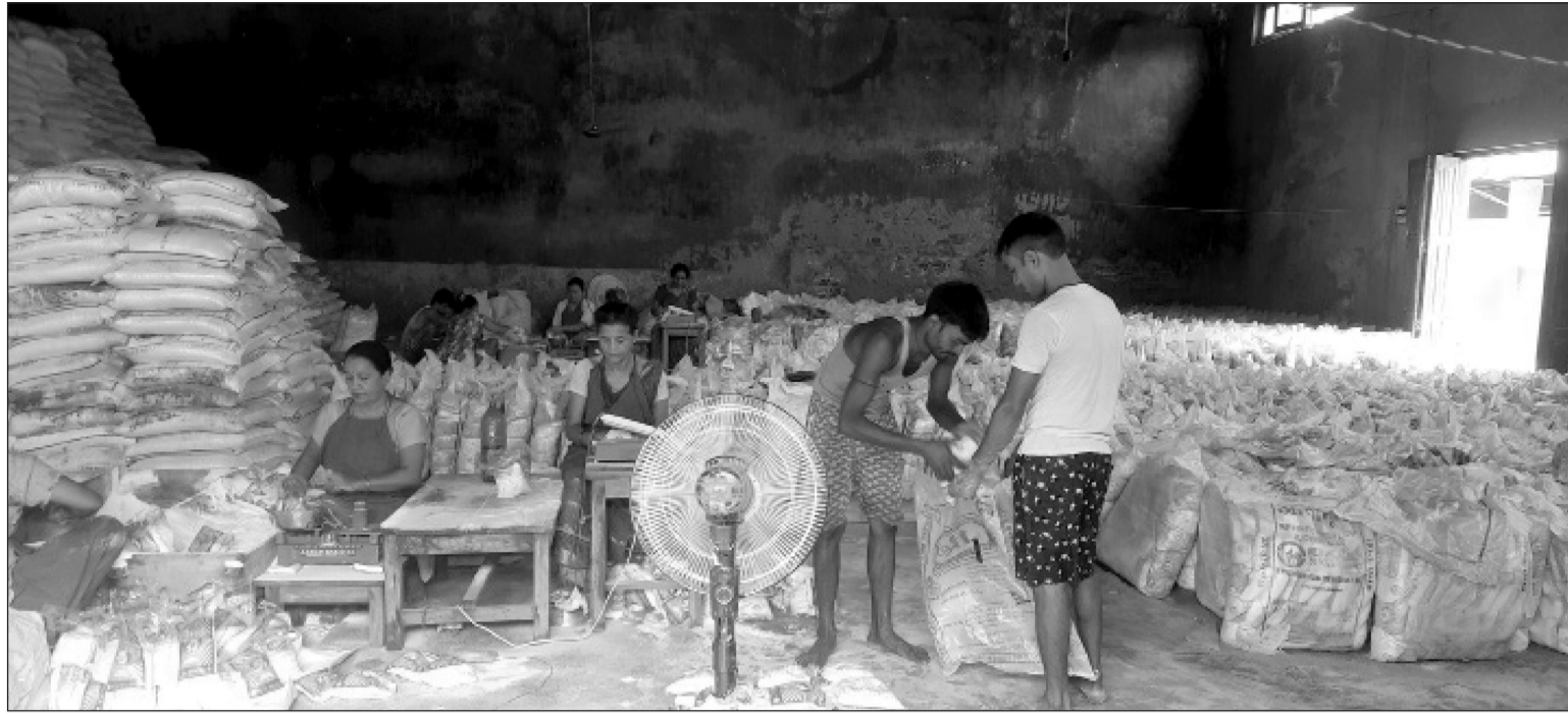
वीरगञ्जमा नुनको प्याकेजिङ : साल ट्रेडिङ कर्पोरेसन लिमिटेड प्रादेशिक कार्यालय वीरगञ्जमा आयोजित नुनको प्याकेजिङ गर्दै श्रमिक। गत असार १८ गतेदेखि एक किलोग्राम नुनको मूल्य रु २६ कायम गरिएको छ।