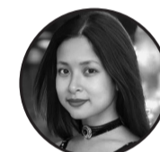
लेखक : रशमी दनुवार मोरङ, नेपाल

श्रावणको महिना, हरियालीले ढाक्यो वनपाखामा रमभ्रम, सुन्दरताले सजायो। मलामीको गीत, भरनाको संगीत धरतीको हृदयमा, नयाँ आशा पलायो। पवित्र र पावन, यो महिना अचम्मको श्रद्धा र भक्ति, हर मनमा बस्यो। मेघको गर्जन, बसेको अमृत पानीले भिजायो, सारा जगता। तीजको रौनक, सिन्दूरको चमक नारीहरूको खुशी, सिन्दूरको धमका। शिवजीको पूजा, मनको कामना श्रावणको महिमा, हर कोनेमा फैलियो। हरेक श्रावण, नयाँ सुरुवात सपना र आशा, नयाँ उज्यालो साथ।