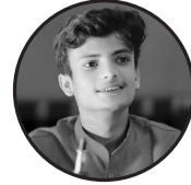
रचनाकार : संतोष भडा ठेगाना : जनकपुरधाम-८