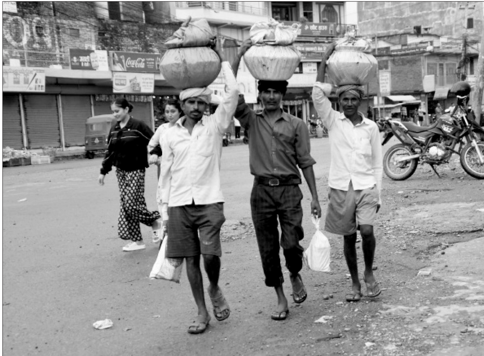
दाङको घोराही बजारमा दही बिक्री गर्न आएका देखुरी राजपुर गाउँपालिका-३ स्थित बेला गाउँका यादव समुदायका किसान। गाउँमा दूध खपत नहुने तथा सङ्कलन केन्द्र नभएकाले बेलाका किसान चालीस किलोमिटर टाढा घोराही बजार दैनिक आवतजावतको रु ४०० गाडीभाडा तिरेर आफूले जमाएको दही बिक्री गर्न आउने गर्छन्।