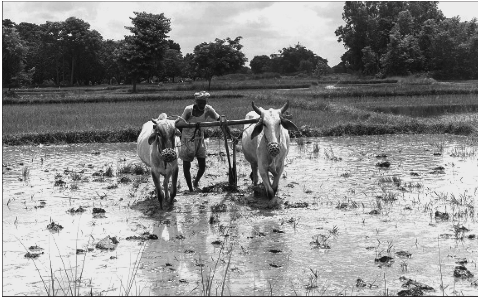
धनुषाको कमला नगरपालिका-३ सघाराका एकजना किसान बिहीबार दिउँसो धान रोपका लागि गोरुको सहयताले खेतमा माटो हिल्याउँदै। यता दुईवटा गोरुको सहायताले हलो जोत्ने परम्परा करिब अन्त्य हुने अवस्थामा छ।