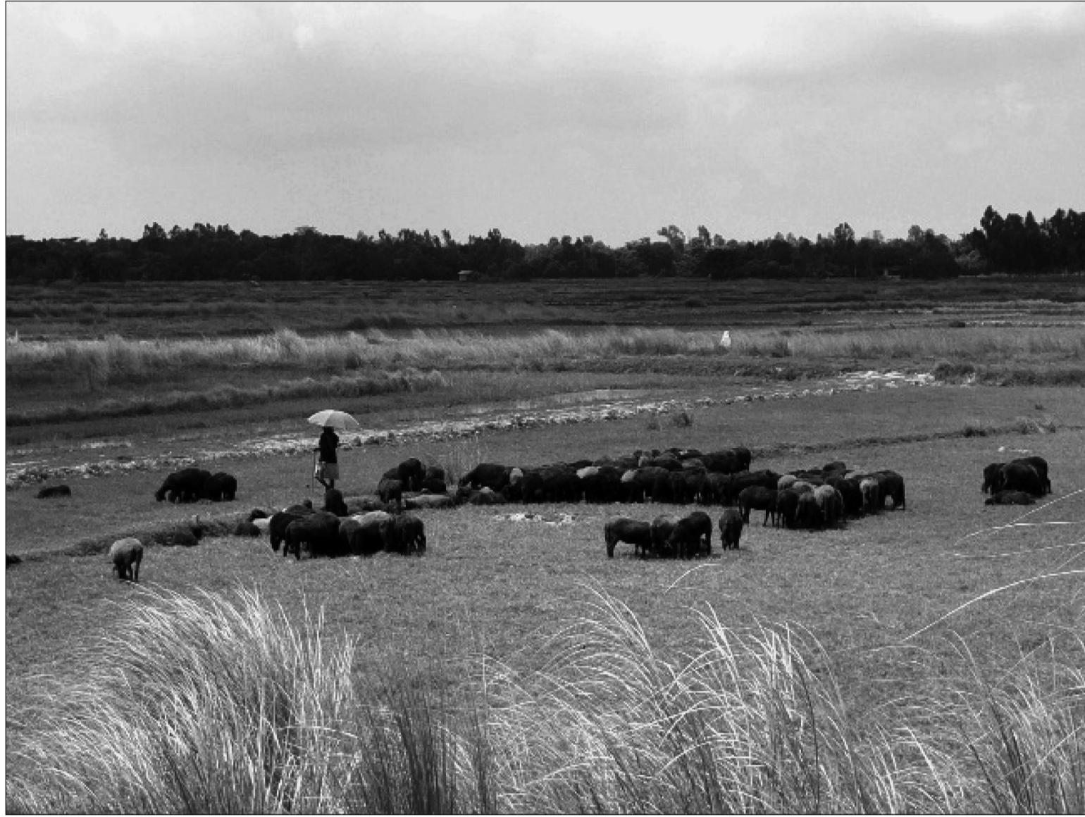
महोत्तरी जिल्लाको जलेश्वर नगरपालिका -६ स्थित वन क्षेत्रमा भेडा चराउँदै एक किसान ।