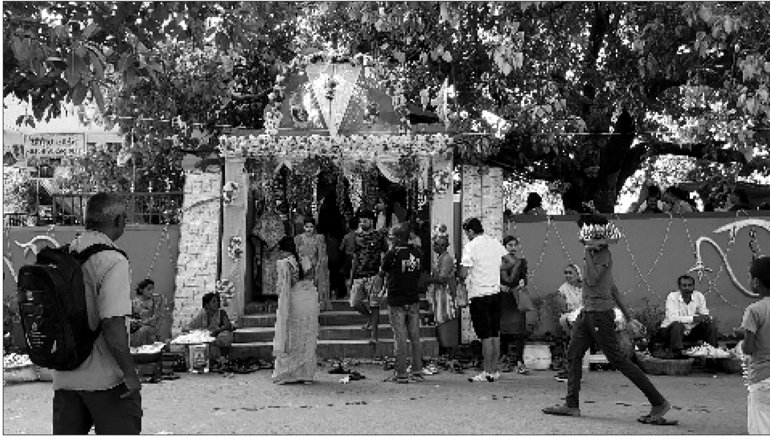
जनकपुरधामको विषहरा पोखरीको अगाडीमा नाग पंचमीको दिन शुकुबार नागपुजा मनाइँदै ।