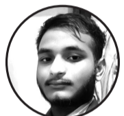
लेखक : नविन कुमार यादव ठेगाना : सुखिपुर नगरपालिका -०७ सिरहा नेपाल हाल ठेगाना : जनकपुरधाम (भानुचौक)

कानको बाली मन पराउने ॥ उनको गाली मन पराउने केही त विशेष होलान् उसमा कि उनलाई मुटु खाली मन पराउने॥