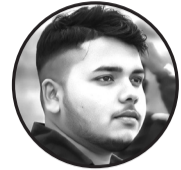
लेखक : मुकेश कुमार यादव सबैला ११ इन्वर्वा

घरको जेठो छोरो म जमिंदारी प्रति एकोहोरो म घरको जेठो छोरो म आमाको ओठमा मुस्कान अनि बाको शिरमा सान कमाउन हिडेको घरको जेठो छोरो म