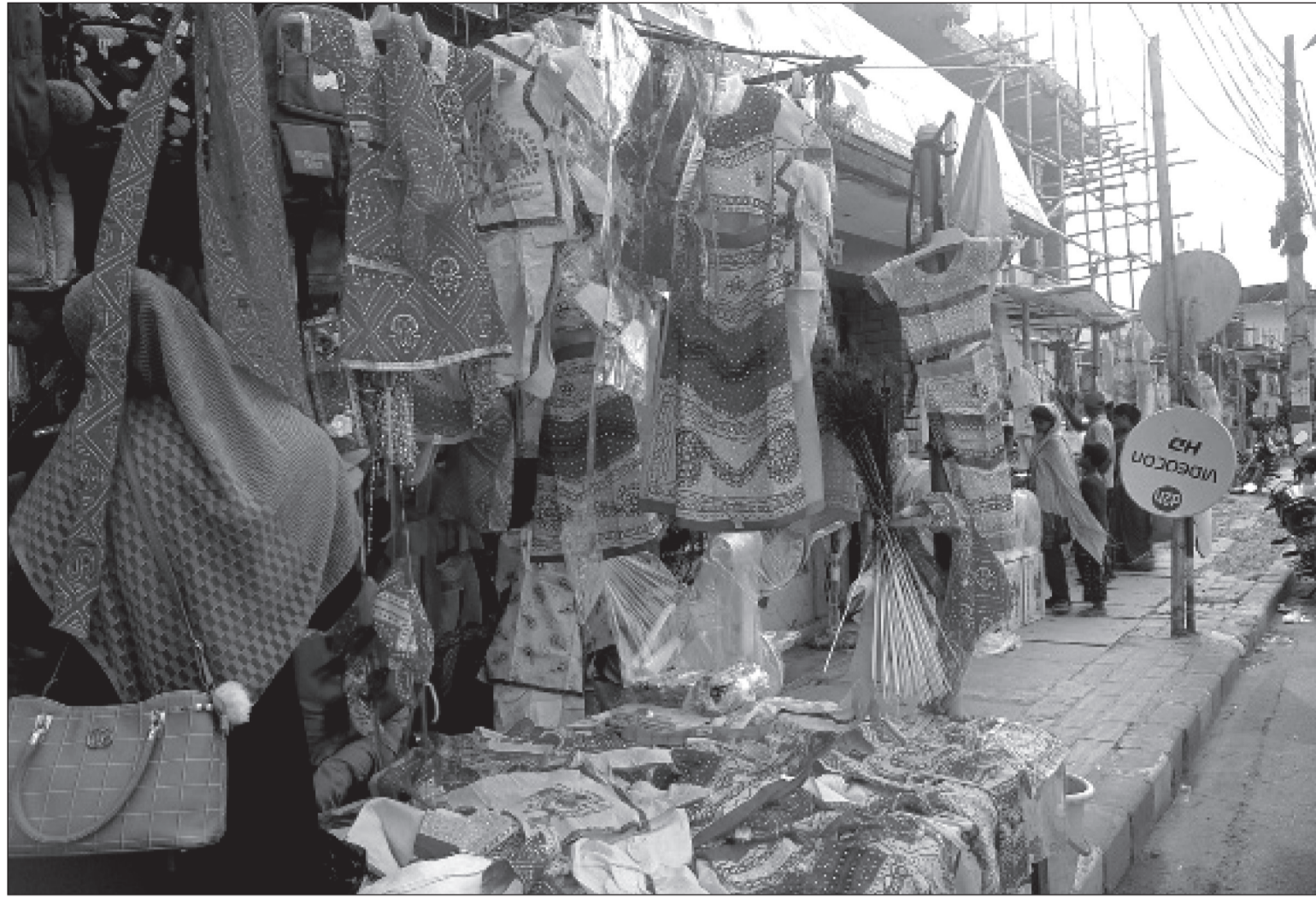
श्रीकृष्ण जन्माष्टमीको पूर्वसन्ध्यामा आइतबार बजारमा बिक्रीका लागि राखिएका जन्माष्टमीलक्षित राधाकृष्णका पोशाकलगायत पूजा सामग्री ।