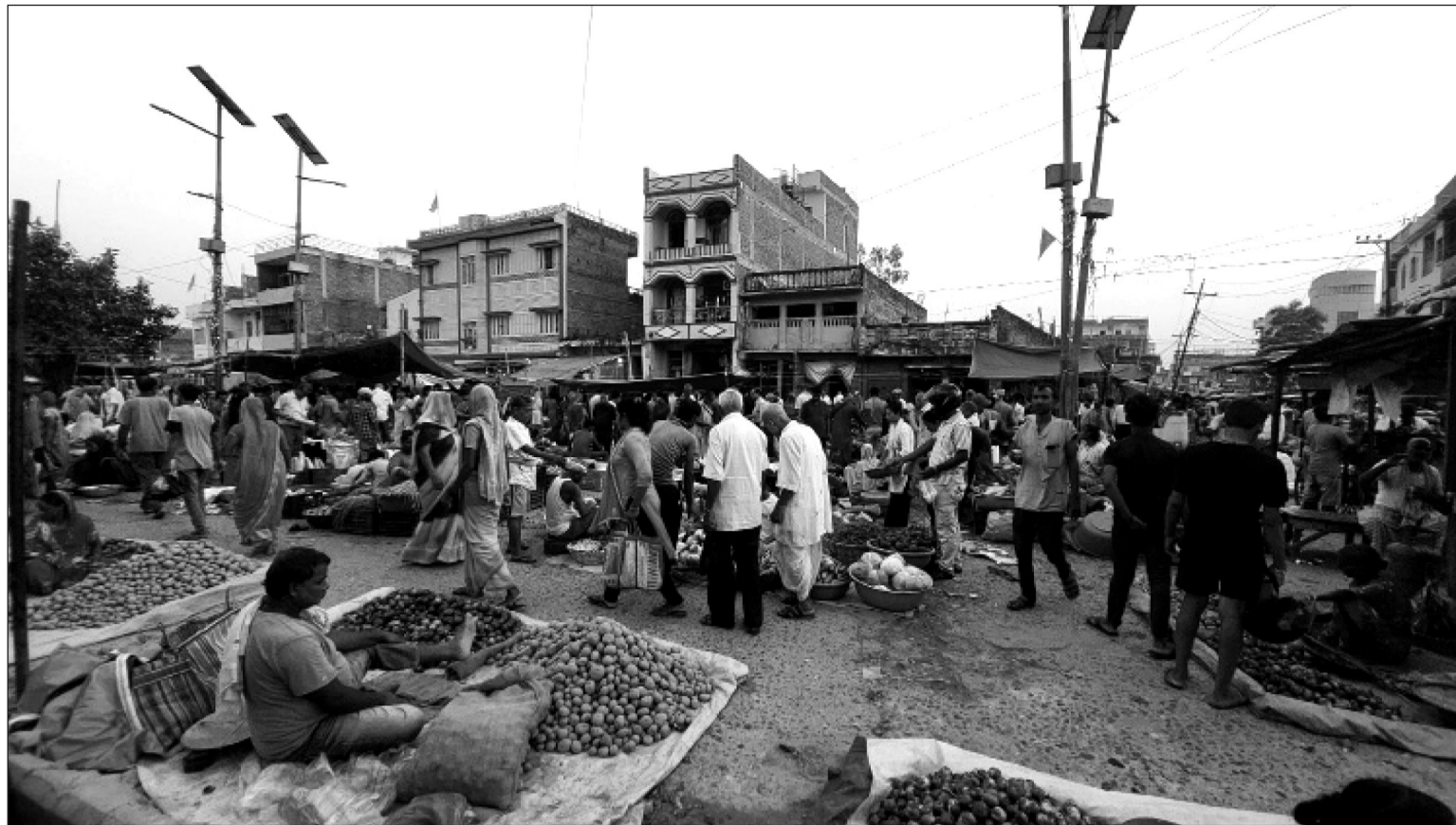
दशौ आगमन हुन एक दिन मात्रै बाकि रहेको अवस्थामा पनि जनकपुरधामको पेठोया बजारमा चहल पहलमा कमी नै देखिएको छ। चाडपर्वमा पनि उपभोक्ता उत्साहित देखिएपनि।