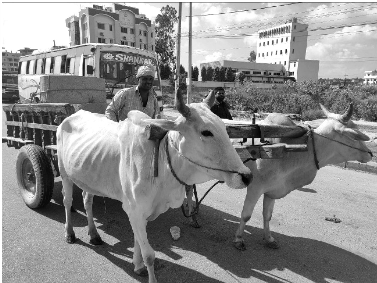
जनकपुरको बसपार्कअगाडि जलेश्वर जानेबाटोमा गोरूगाडाबाट घर परिवोजनाका लागि एक व्यक्ति निर्माण सामग्री ओसार्दै। अहिले आधुनिक प्रविधिको विकाससँगै फलमे र स्टिलबाट निर्मित सवारीसाधनको प्रयोग बढेका कारण गोरूगाडा तराईका जिल्लामा कम्ती मात्रा देखिन पाइन्छ।