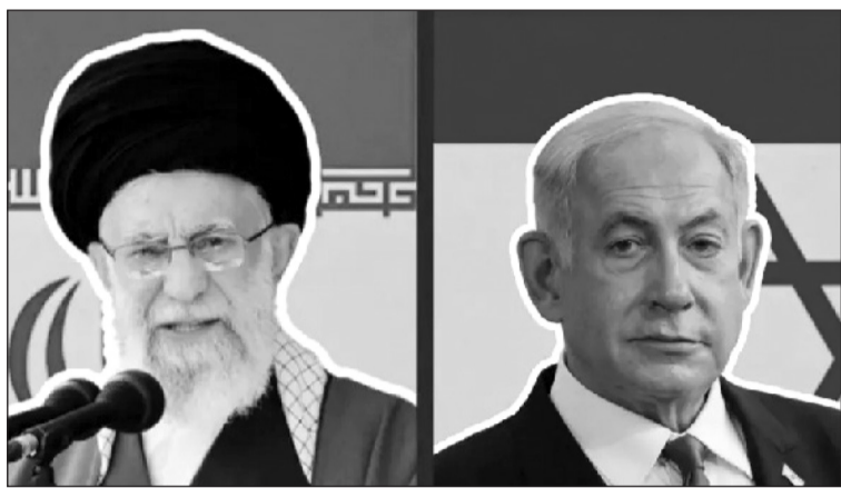
प्रणालीका मेरुदण्ड हुन्।

बीबीसी काठमाण्डु। इजरेलले इरानमा गरेको हवाई हमलाका कारण राजधानी तेहरान सहितका ठाउँमा विस्फोटका आवाज सुनिएका छन्। इजरेली सेनाले इरानका सैन्य निशानाहरूमा प्रहार पछि आफ्ना विमानहरू सुरक्षित रूपमा स्वदेश फर्किएको जनाएको छ। इजरेलले अक्टोबर १ र त्यसपछि इजरेलमा क्षेप्यास्त्रहरू प्रहार गरेर हवाई हमला गरेको बढलाका आक्रमण गरिएको इजरेल डिफेन्स फोर्सस आइडिएफले जनाएको छ।