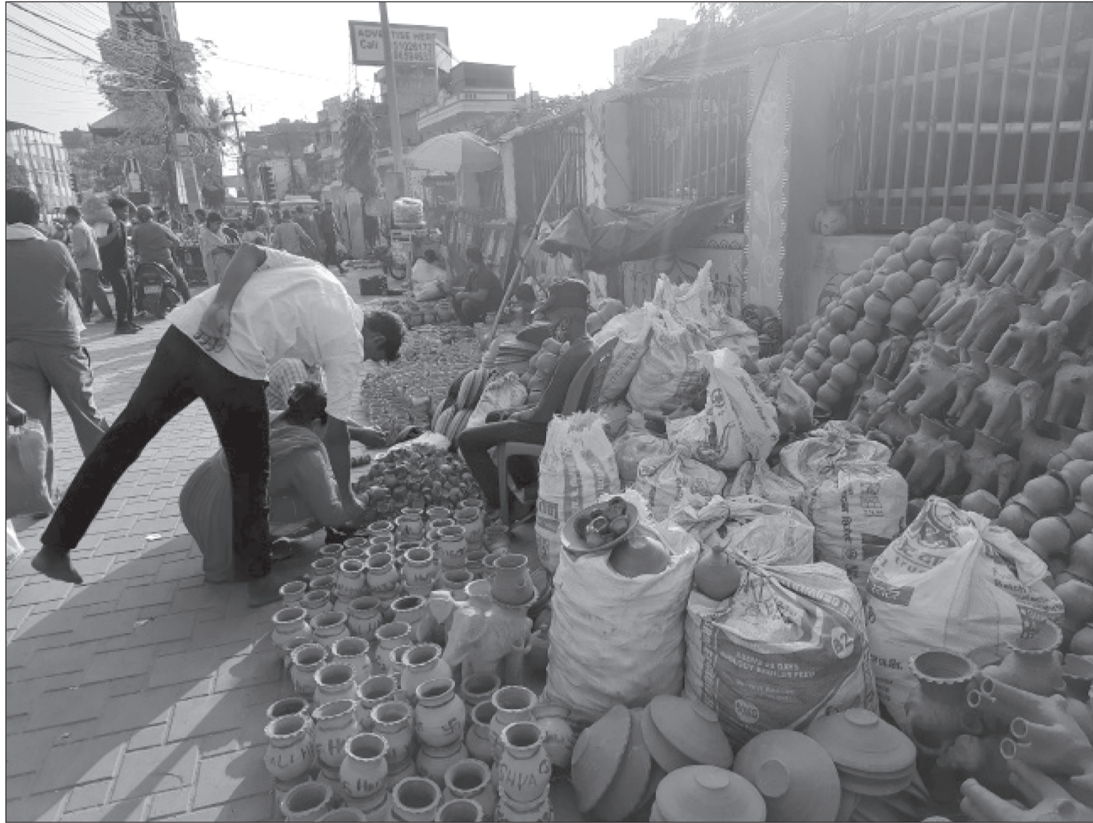
वीरगञ्जको घण्टाघरनजिकै सडकमा दीपावलीका लागि बिक्रीमा राखिएका माटाका पाला, कलशलगायतका सामग्री बिक्री गरिँदै। पछिल्लो समय भ्रूलर र भिर्नालमिल बत्तीको कारणले माटाका पालाको प्रयोग कमी हुँदै आइरहेको छ।