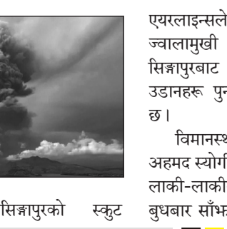
यसैबीच, सिङ्गापुरको स्कुट

सुरक्षित स्थानमा सारिएको थियो। मौसम 'सुधिएको' अवस्थालाई उल्लेख गर्दै क्वान्टास र जेटस्टारले बालीमा आफ्नो सेवा पुनः सुरु गरेको विज्ञापितमा फर्त जनाएका छन्। एयरएशियाले बिहीबारदेखि बाली जाने उडानहरू पुनः सुरु गर्ने जनाएको छ भने अस्ट्रेलियाले आफ्नो वेबसाइटमा उडानहरू पुनः सुरु गर्ने बताएको