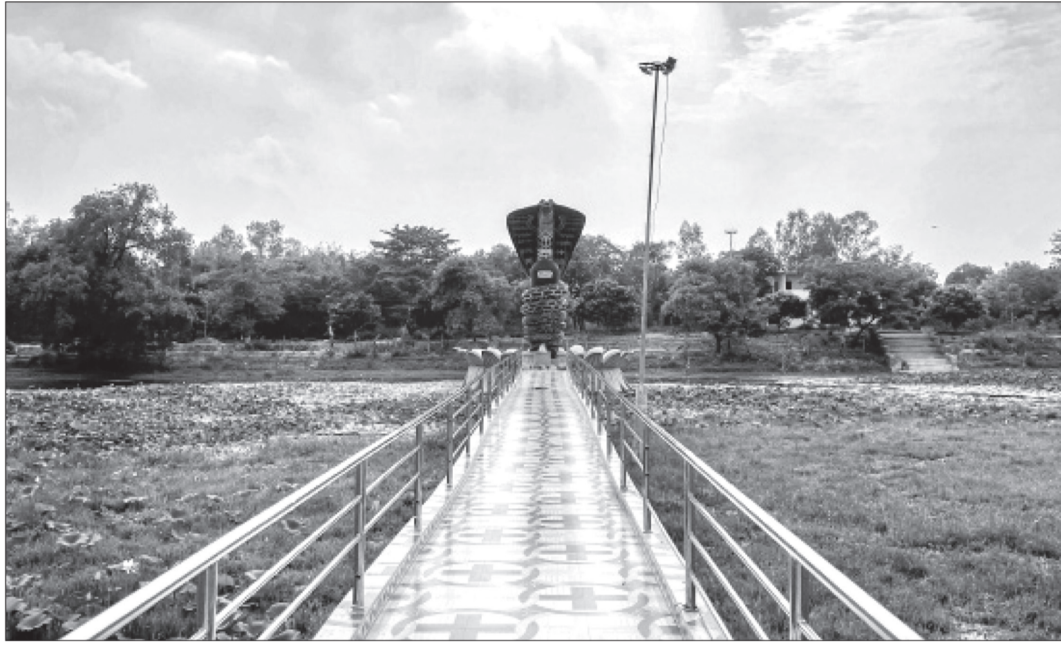
धनुषाको मिथिला बिहारी नगरपालिका-२ पुनर्दाहास्थित ऐतिहासिक, सांस्कृतिक एवम् आध्यात्मिक सरोवर परशुराम तलाउको मध्यभागमा रहेको कमलको फूलमा नागसहित शिवलिंगको प्रतिमा।