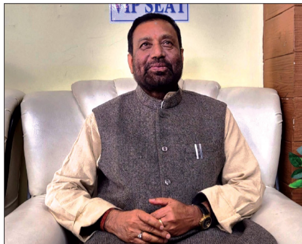
भ्रमणको तयारीमा रहेको र उनलाई कुनै पनि ऋण सम्झौतामा हस्ताक्षर

नगर्न कांग्रेसले भनिसकेको नेता निधिले बताए। नेता निधिले भने प्रधानमन्त्री ओली चीन भ्रमणको तयारीमा हुनुहुन्छ, कांग्रेसले अनुदान सम्झौता मात्रै भनेको छ, ऋण सम्झौता नगर्ने पहिले नै भनिसकेका छौं।