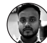
लेखक: मुकेश साह जनकपुर -१

नेपालको सेयर बजार पछिल्लो केहि वर्षमा तीव्र परिवर्तनको दौरमा रहेको छ। यसले नेपालका लगानीकर्ताहरूलाई विविध अवसरहरू प्रदान गरेको छ भने, बजारको अस्थिरता र जोखिमले केही चुनौतीहरू पनि निम्त्याएको छ। नेपाल स्टक एक्सचेन्ज (लम्पेक्स) को वृद्धि र घटबदलले अर्थतन्त्रको समग्र स्वास्थ्यमा प्रभाव पार्ने गर्दछ। नेपालका सेयर बजारमा नयाँ लगानीकर्ताहरूको बढ्दो सहभागिता र पूँजीको वृद्धि देख्न सकिन्छ, जसले यो क्षेत्रलाई अर्भ आकर्षक बनाएको छ। तथापि, बजारमा हुने उतारचढाव र स्ट्रेबाजीको प्रवृत्तिले दीर्घकालीन लगानीका लागि चिन्ता पैदा गरेको छ। नेपालको सेयर बजारमा पारदर्शिता र सूचना प्रवाहको अभाव एक प्रमुख समस्या बनिरहेको छ। धेरै कम्पनीहरूले मुनाफा र वित्तीय स्थितिमा बारेमा पर्याप्त र स्पष्ट जानकारी प्रदान गर्दैनन्, जसले लगानीकर्ताहरूलाई भ्रमित बनाउँछ। यसैले, लगानीकर्ताहरूलाई राम्रो निर्णय लिान कठिनाइ हुन्छ। त्यस्तै, नियामक संस्थाहरू र बजार