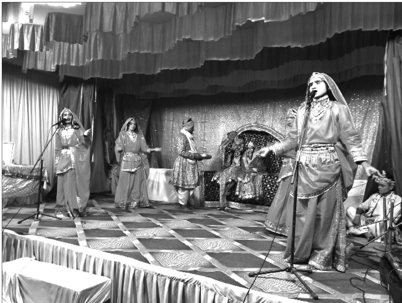
नेपालगञ्ज उपमहानगरपालिका -६ फुल्टेक्रामा जारी हडियाबाबा मेलामा बिहीबार राति रामलीला मञ्चन गर्दै कलाकारहरु ।