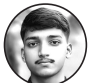
लेखक विवेक साह जनकपुरधाम ८ डिप्लोमा इन कम्प्युटर इन्जिनियरिङ (६ सेमेस्टर)

समुदायको माया सधैं नयाँ हुन्छ, एकताको धागोले मन सजना हुन्छ। सुख-दुःखमा साथ दिन खुब्रु पछाडि हट्टैने, हाम्रो मनको बाटो कहिल्यै तडिडा हुन्छ। भिन्न जात, धर्म सबै एउटै बन्छ, माया र सहयोगले सारा संसार बन्छ। जति ठूलो आँधी होस्, हामी डराउँदैनौं, साथ मिल्दा हाम्रो शक्ति अमर हुन्छ। एकतामा रमाउने हाम्रो गाउँ छ, मनले जोडेपछि सारा सम्भव हुन्छ।