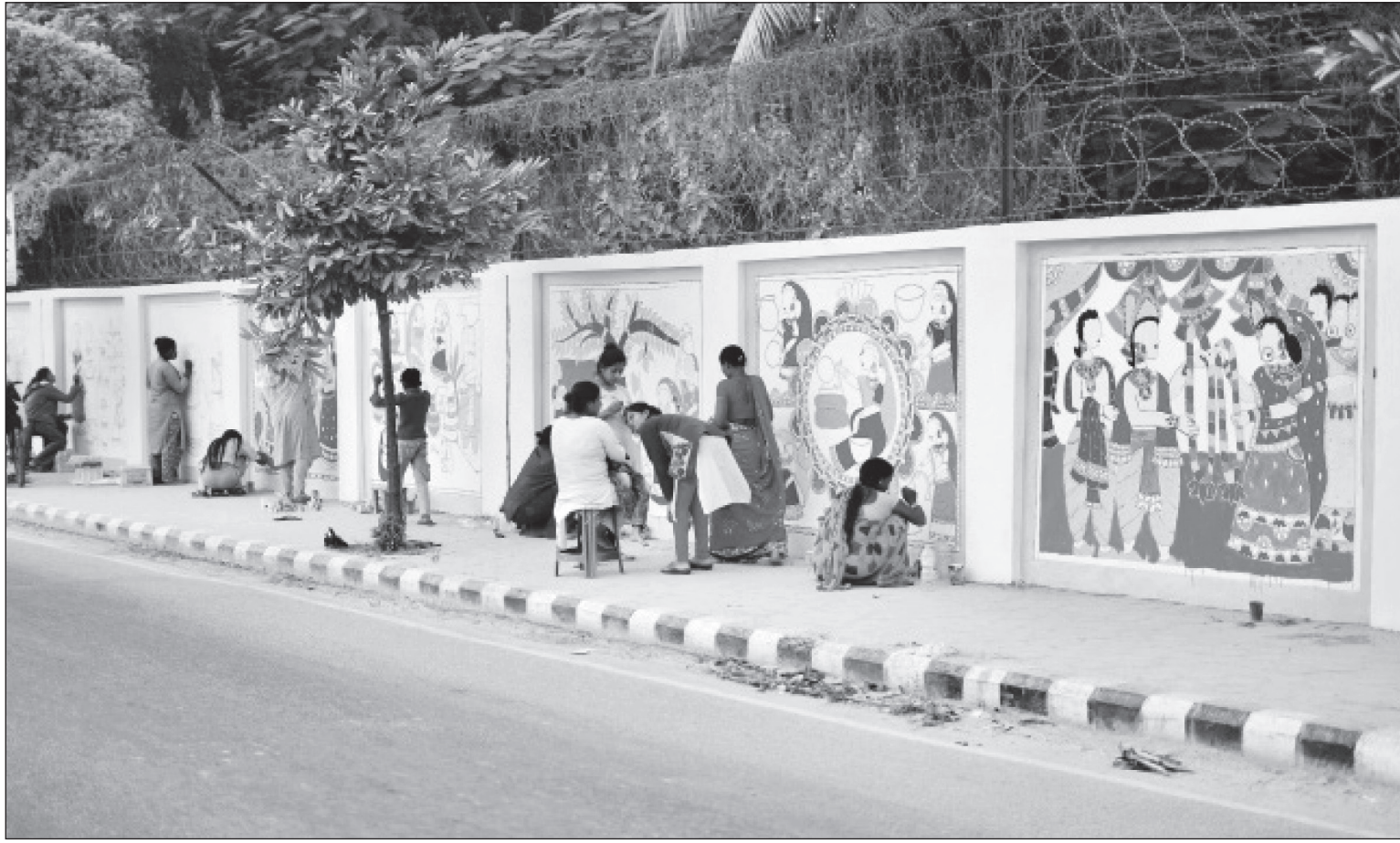
मिथिलाको पहिचान भल्काउने र मिथिलाकला विश्वभरि चिनाउने अभियान अन्तर्गत मुख्यमन्त्री तथा मन्त्रपरिषद्को कार्यालय मधेश जनकपुरधामको भित्तामा मिथिला चित्रकला कोर्दै चित्रकर्ता।