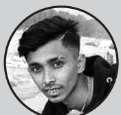
दिपक ठाकुर देवि चौक, जनकपुरधाम

स्थानीय बासिन्दाहरू विभिन्न स्वास्थ्य समस्याबाट ग्रस्त छन्। अत्याधुनिक फोहोर व्यवस्थापन प्रणालीको अभाव र जनताको लापरवाहीले समस्या भन्नु जटिल बन्दै गएको छ। यस समस्याको समाधानमा जनताको भूमिकालाई प्राथमिकता दिनुपर्छ। जनतालाई फोहोर व्यवस्थापन र सरसफाइको महत्त्व वबारे सचेत गराउनु आवश्यक छ। सहरलाई सफा र व्यवस्थित बनाउन प्रत्येक नागरिकले आफ्नो जिम्मेवारी वहन गर्नुपर्छ। घर-घरबाट फोहोर वर्गीकरण गर्ने प्रणाली लागू गर्नुका साथै पुनः प्रयोग र रिसाइकलका उपायहरू अपनाउनुपर्छ। यस्तै, स्थानीय समुदाय र सहकारी संस्थाहरूको सहकार्यले सहरको सरसफाइलाई प्रभावकारी बनाउन सक्छ। जनकपुरलाई सफा, हरित, र सुन्दर बनाउन सरकार र नागरिकको संयुक्त प्रयास जरुरी छ। नगरपालिकाले दीर्घकालीन योजनाका लागि स्रोत साधनको समुचित प्रयोग गर्नुपर्छ भने नागरिकहरूले सचेत र जिम्मेवार व्यवहार देखाउनुपर्छ। सरोवरहरूको पुनर्निर्माण, सडक सुधार, र फोहोर प्रशोधनका लागि ठोस कदम चाल्न जरुरी छ। यसरी, सामूहिक प्रयत्न र इच्छाशक्तिको माध्यमबाट मात्र सुन्दर जनकपुर, सफा जनकपुरको सपना पूरा गर्न सकिन्छ।