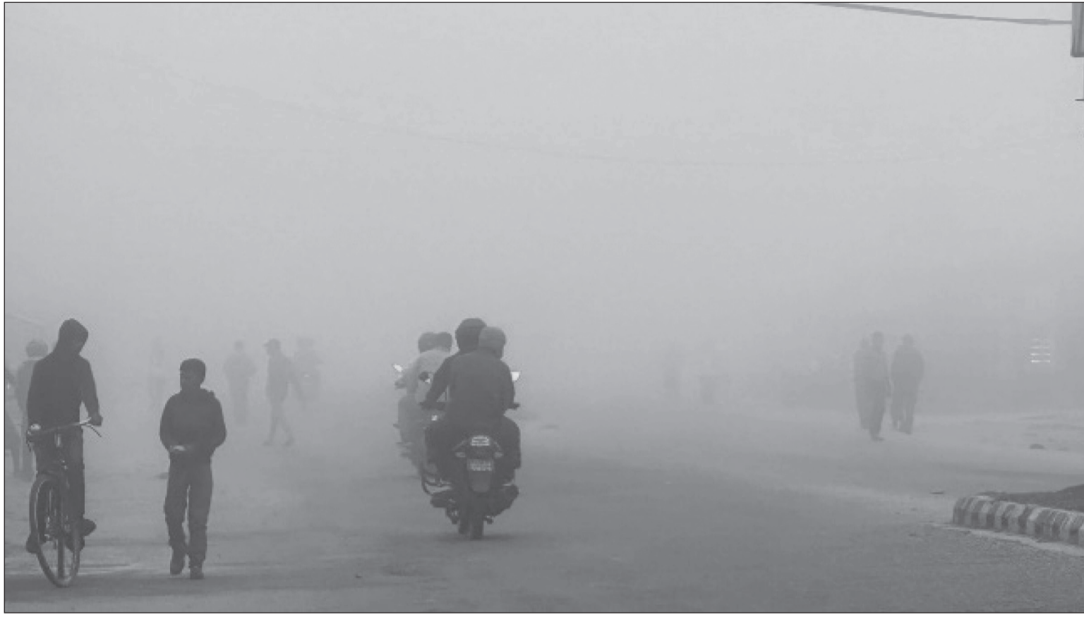
सर्लाही सदरमुकाम मलङ्गवामा बुधवार बिहान लागेको बाक्लो कुहियो ।