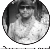
लेखक: बब्लु शर्मा ज. उ. न. पा. ७

आयो सुखको दिन, हर्षको रौनक, तिमीलाई हेरे मन भरि उल्लासा बिहेको पर्व, रङ्गी मूहारा, सपना पुरा भयो, बहिनिको संसार आधिकारिकता, नयाँ घरको ढोका, मायाले सजिएको नयाँ उसको चोका। प्यारी बहिनी, सन्देश ल्याउने, पढ्न न सक्ने संसारको रंगिनी। आनन्दका गीत, हर्षका रचना, तिमीले बाँचेछौं नयाँ जीवन यात्रा। सपना र आशा सँगै मिलाए, सपना पुरा हुनेछ जीवनमा त्यो टेहरा। जीवनका हर्ष र दुःखका समय, सँगै हाँसेछौं र बाँचेछौं सबै। आधा भाग्य एक अरुसँग जोडिए, सपना तिमीलाई साकार हुनेछ, बहिनी मेरो प्यारी। यस यात्रा मा हामी सँगै बस्ने, तिमी खुशी रह, जीवन रमाइलो सँग लिने। माया र आशीर्वादले भरिपूर्ण यो यात्रा, तिमीलाई धन्यताको साथ बिहेको शुभकामना।