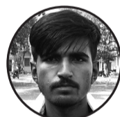
लेखक: राम पुकार महतो (बिद्रोही) बर्दियास, महोत्तरी

यस पर्वले समाजमा शान्ति, सद्व्यवहार र भाईचारेको सन्देश दिन्छ। यस दिनको माध्यमबाट, हामी सबैलाई धर्म, सत्य र प्रेमको महत्त्वको स्मरण गराइन्छ, र सबै धर्म, जाति र समुदायका मानिसहरूलाई एकजुट गराउने सन्देश पनि प्रदान गरिन्छ। बिबाह पञ्चमीको पर्वले समाजमा सकारात्मक विचार र कार्यहरूको प्रोत्साहन गर्दछ, जसले मानवता र समाजमा सहअस्तित्वको भावना बढाउँछ। समाजमा, बिबाह पञ्चमी एक यस्तो पर्व हो जसले राम र सीताको पवित्र विवाहको सम्झनामा हामीलाई आदर्श जीवनका मूल्यहरू र धर्मका सिद्धान्तहरूलाई आत्मसात गर्न प्रेरित गर्दछ। यो पर्व न केवल धार्मिक आस्था र विश्वासको उत्सव हो, बरु यसले समाजमा एकता, प्रेम र सम्मानका मूल्यहरूको महत्त्वलाई बल पुर्याउँछ। बिबाह पञ्चमीका दिन, हामीले राम र सीताको विवाहलाई एक प्रेरणा र आदर्शका रूपमा हर्षका साथ मनाउनु पर्दछ, जसले हामीलाई जीवनमा साँचो प्रेम र सदगुणका बाटोमा हिँड्नका लागि मार्गदर्शन गर्छ।