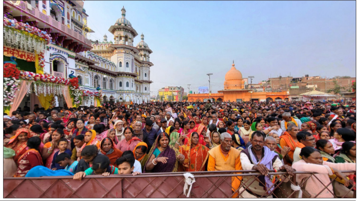
सीताराम विवाह पञ्चमी महोत्सव अन्तर्गत स्वयम्बरको क्रममा सीतामाताको डोलासहित जानकी मन्दिरबाट निस्किएको भाँकी: