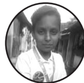
लेखक: आयुष साह जनकपुरधाम-०६ (महावीर चौक) मदर टेरेसा पब्लिक स्कूल कक्षा ४

उ बोल्दैन तर मलाई सुने जस्तो लाग्छ हेर्दा देखिन्छ तर सँगै हुने जस्तो लाग्छ सहि गलत बखुबी थाहा छ उस्ताई ईसारा गछ तर मुख थुने जस्तो लाग्छ दुःख र सुखको पातले टपरी उसेले बनाउछ आकार बुझिन तर पत्र पत्र बुने जस्तो लाग्छ गंगा मा हात धोए स्पर्श मिल्दैन उस्को लौकिक नहोला तर कर्मले छुने जस्तो लाग्छ दिनुःखीको भाकामा सुनाउदा गाईने दाईले रमाउछ सारङ्गी तर उ रने जस्तो लाग्छ जिन्दगीको यात्रामा लडेर फाटोको जीवन प्याकन खोज्छु तर उस्ले तुने जस्तो लाग्छ उ बोल्दैन तर मलाई सुने जस्तो लाग्छ ईसारा गछ तर मुख थुने जस्तो लाग्छ