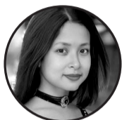
लेखक: रशमी दनुवार मोरङ्ग, नेपाल

शुभ विवाहपञ्चमी आयो, सन्देश ल्याए, मायाको रङ्गमा, संसारलाई सजाए। सपना र आशा, दिलमा हराउँदै, जीवन यात्रा सँगै हामी अघि बढाउँदै। मन्दिरको मन्द मुस्कान भक्तिको, भगवानको कृपा, सबैमा बरिस्को। मिलनको समय, भगवानको आशीर्वाद, प्रेम र समर्पण होस् हाम्रो यत्र साधा सात फेरे, सात जन्मको वचन, प्यार र समर्पणबाट बनेको सन्देश जीवना सपना पुरा होस्, प्रेमको मार्गदर्शन, शुभ विवाहपञ्चमी होस् सबैको मनको शान्ति। शुभकामना र आशीर्वादको साथ, सपना पुरा होस् नयाँ पथा विवाहको पवित्रता बढोस्, शुभ विवाहपञ्चमीले सधैं समृद्धि ल्याओस्।