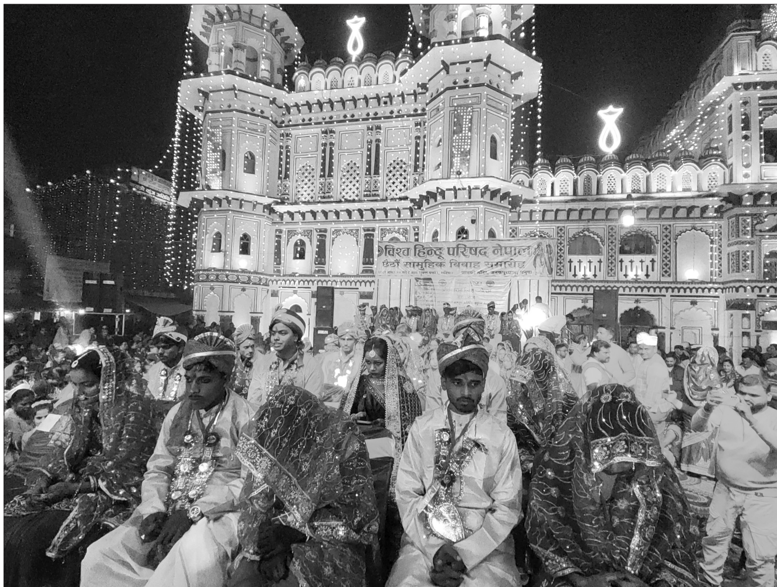
जानकी मन्दिर परिसरमा विश्व हिन्दू परिषदद्वारा आयोजित छैठौं ३४ जोडीको सामूहिक विवाह समारोह।