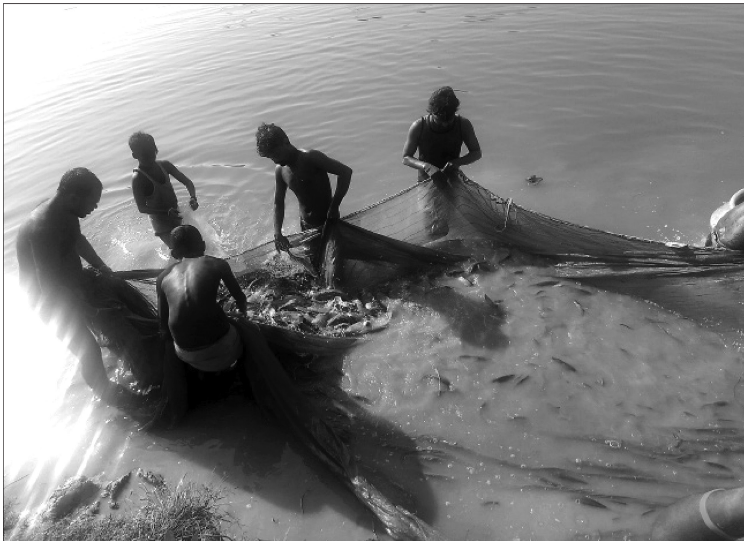
महोतीको जलेश्वर नगपालिका-८ स्थित गौतमान पोखीमा जाल हाले माछा मार्दै माछीहरू ।