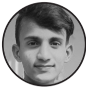
लेखकः नवल प्रसाद यादव ठेगानाः सखुवा प्रसौनी गाउँपालिका पर्सा

एकै आँगन खेलेका थियौं, एकै थालमा खाएका थियौं। समय आयो जग्गा बाँड्ने, भाइभाइले शुरू गरे भगडा सानो। बाबुको पसिना बगेको माटो, आज भयो रिसको घाँटो। मेरो हो भन्दै तर्क गरे, तेरो होइन भन्दै भर्के परे। मायाभन्दा ठूलो जमिन भयो, सम्बन्धभन्दा धन प्रिय भयो। टुक्रिएर मन, टुटे विश्वास, रगतको नाता बन्यो इतिहास। समयले सिकाउँछ एक दिन, सम्बन्ध नै हो जीवनको चिना