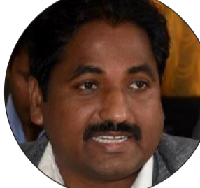
आफैँ बोलिरहेको छ सरकार ढल्छ। प्रधानमन्त्री आफैँ हप्ताको एकपटक