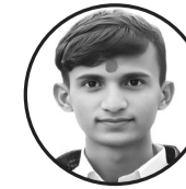
लेखकः नवल प्रसाद यादव ठेगानाः सखुवा प्रसौनी गाउँपालिका . पर्सा

तराईको माटो, हरियालीको थाल, तर पनि हिउँदमा चिसोले समाउँछ काल। ओढ्ने कम्मल, बस्ने घर छैन धेरैको, साँस रोकिन्छ रातभरि, थरथराउँछन् बेसहारा कोही। कुहिलोले ढाक्छ, दिन पनि रातजस्तै, तातो घाम खोज्दै न्यानोको आसै। आगोको छेउमा जम्मा हुन्छन् थाकेका पारबुरा, तर पनि छैन त्यहाँ सबैका लागि सहारा। तराईको चिसोमा लरबराउँछ जिन्दगी, न्यानो सपना सजाउन गाह्रो छ यहाँ बाँच्ना के छ उपाय, के छ समाधान? सबैलाई पुग्ने एउटा मानवताको योगदान। हेर, त्यो बच्चा, चिसोले निथुक्क भिजेको, आफ्नै सुकिला लुगामा पनि आँसुले लथालिग भएको। हामीले के गर्न सक्छौं यिनीहरूको लागि? सिर्जना गरौं न्यानो मुटु र माया बाँड्ने साथी। तराईको चिसोमा दिन जिउन सजिलो होस्, हरेक परिवारले न्यानो रात बिताउन पाओस्। आउनुहोस्, अघि बढौं एकजुट भएर, तराईका ती थरथराउँदो हातहरूलाई समाएर। समाजको कोखमा उर्जा फेर्ने आशा छ, हरेक आँखामा खुशीको प्रकाश छ। न्यानो दिन, उज्यालो रात, तराईले पनि पाओस् न्यानोको बाता