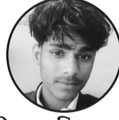
लेखकः मिराज खान ठेगानाः मकौटा रैन टोल मोहोती

इन्टरनेट हो आजको युग, सपना साकार बनाउछ, ज्ञान र जानकारीको खजाना, हरेक पलकमा सजाउछ। सपना पुरा गरिन्छ यहाँ, दूका साथीलाई भेट्न सकिन्छ, सार्वजनिक कुरा, निजी कुरा, सबै कुरा खुल्ला सन्देश बनाउँछ। सपना नयाँ, नयाँ युक्ति, दुनियाँ सँगै जोडिन्छ, तर, यत्रा गरौं सधैँ सचेत, अनलाइन दुविधाबाट बचौं, सुरक्षित जीवन यत्रा गरौं।