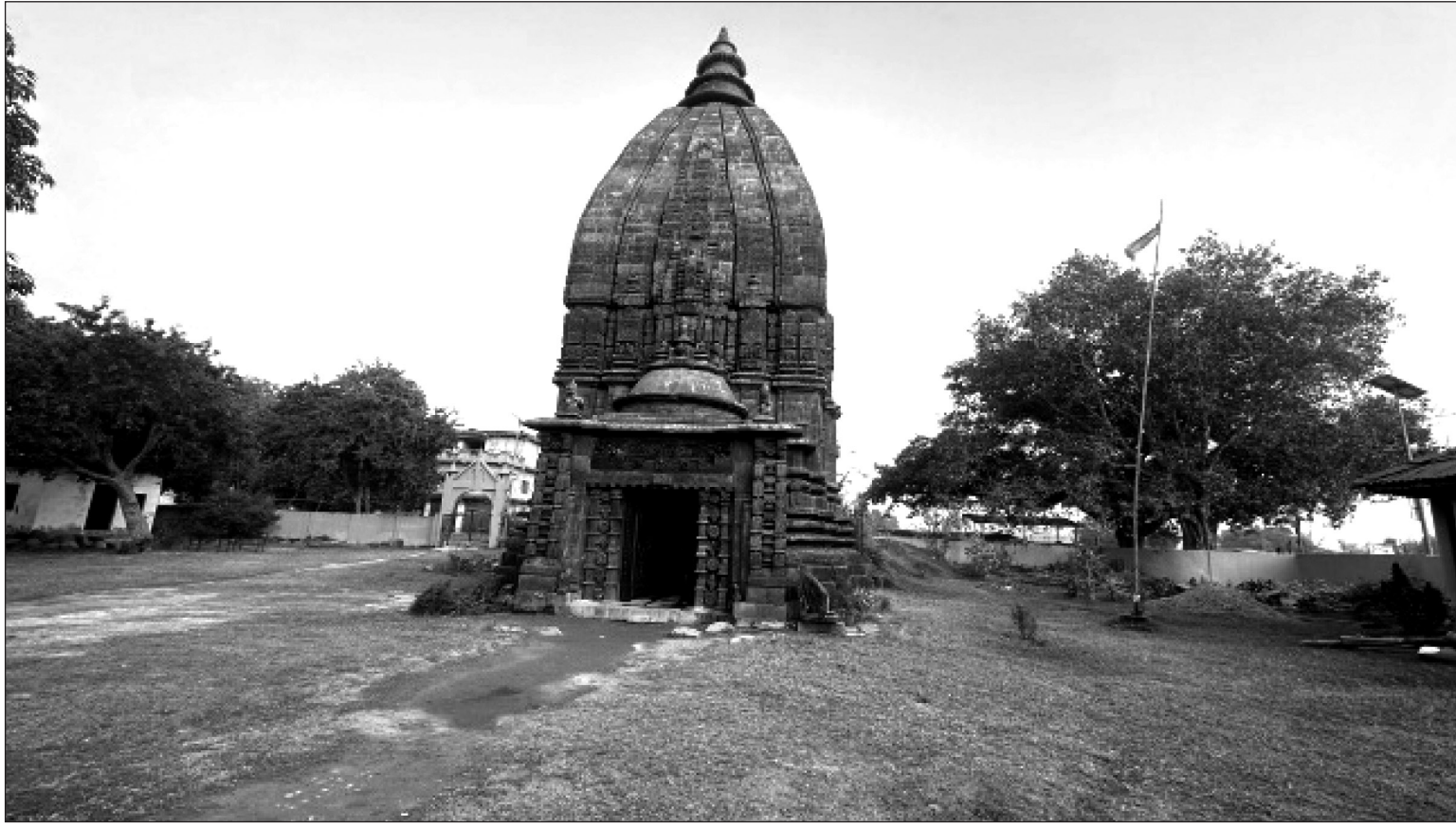
सर्लाहीको बरहथवा नगरपालिका-९ मुर्तियास्थित ऐतिहासिक मुक्तेश्वर महादेवको मन्दिर । पुरातत्व विभागले पुनर्निर्माण गरेको यो मन्दिर परिसरमा धेरै पुराना कलाकृति, ईटा, ढुङ्गालगायतका भनावशेषहरू रहेको छ । यो मन्दिर ११ औं शताब्दीमा निर्माण भई १३ औं शताब्दीमा भत्केको पुरातत्व विभागको अध्ययनबाट देखिएको छ ।