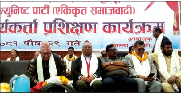
आएको छ ।

अध्यक्ष नेपालले विभिन्न राष्ट्रका सरकार प्रमुखसँग मुलुकको हित र प्रतिष्ठा बढाउन संवाद र छलफल आफूले गरेको बताउँदै जनताको विश्वास र समर्थनले मात्र पार्टी बलियो हुने भएकाले